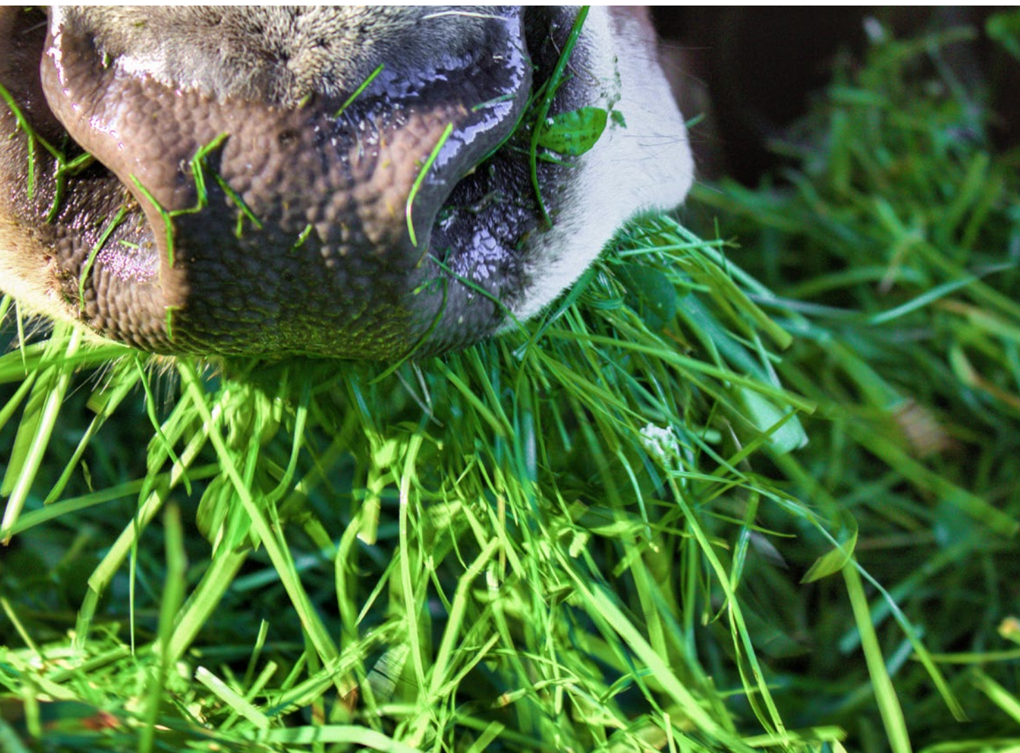
Un rapport équilibré entre les fourrages grossiers et ceux qui sont concentrés permet une production laitière à la fois rentable et respectueuse de l'environnement.