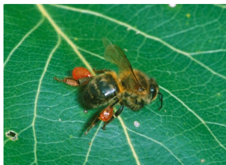
Fig. 2: Ape su foglia con «rocchetti di propoli».