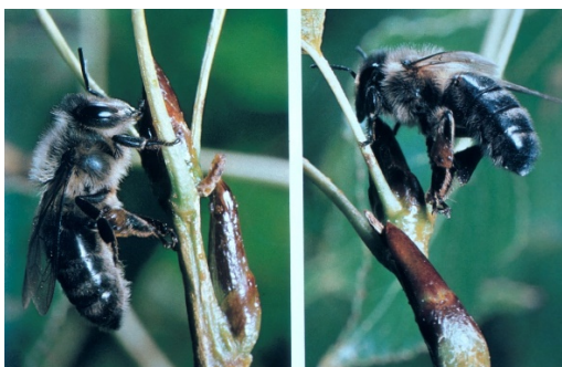
Fig. 1: Ape che bottina la propoli dalla gemma.

In media in Europa una colonia di api bottina tra i 50 e i 150 grammi di propoli all'anno. Le migliori colonie bottinatrici, segnatamente le api caucasiche, possono raccoglierne tra 250 e 1000 grammi all'anno.