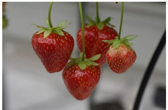
Mit UV-C Licht behandelte Früchte.

Erhebung der Wirksamkeit der Behandlung mit einem UV-C Roboter am 1. Oktober 2025 bei einem Erdbeerproduzenten im Thurgau.