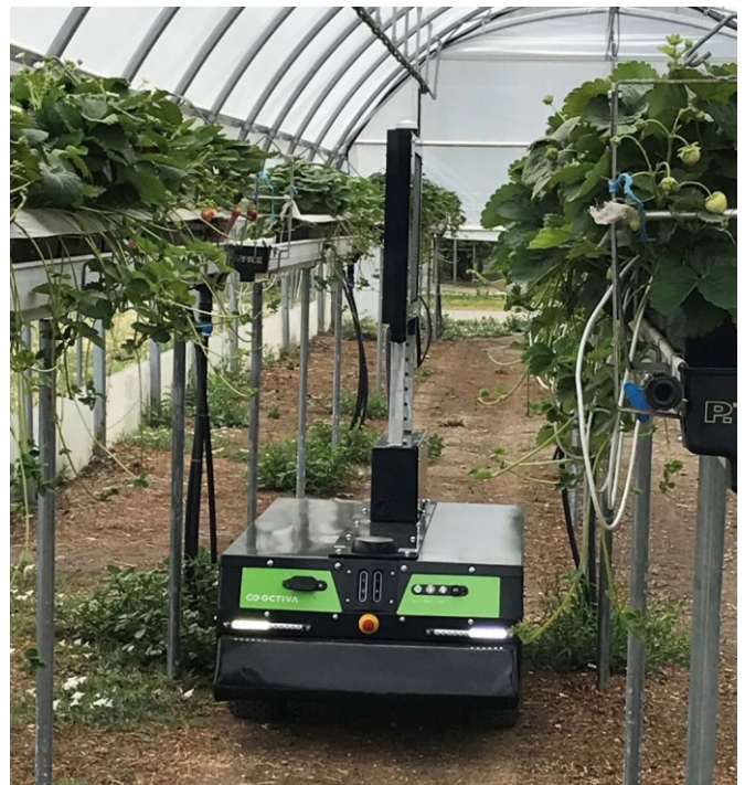
Geländegängiger UV-C-Roboter für den Einsatz in Stellagen im Tunnel.