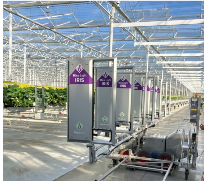
UV-C-Roboter für die Behandlung von sechs Reihen in einem Durchgang in einem Gewächshaus.

Alle diese Geräte, selbstfahrend (Roboter) oder gezogen, verwenden UV-C-Lampen mit einer Wellenlänge von 254 nm.