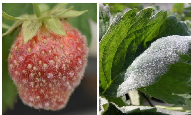
Pilzgeflecht des Echten Mehltaus auf der Oberfläche einer Erdbeerfrucht und eines Blatts.

UV-C-Strahlen mit einer Wellenlänge von 254 nm bewirken eine Beschädigung der DNA, des Erbgutes, der bestrahlten Organismen. Beim Echten Mehltaupilz kann diese Beschädigung zum Absterben des Pilzes führen und dadurch die