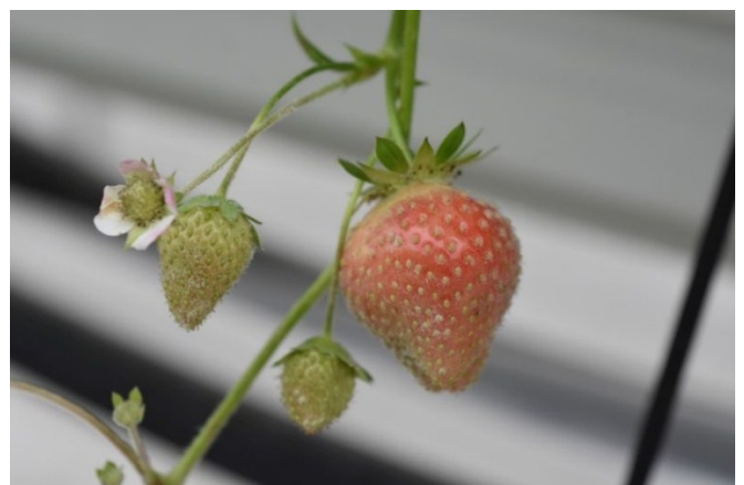
Nicht mit UV-C Licht behandelte Früchte (Kontrolle).