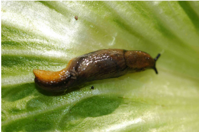
Abb. 4: Gartenwegschnecke ( Arion hortensis ) mit gelb-oranger Kriechsohle.

Auch die Gartenwegschnecken ( Arion distinctus und A. hortensis , Abb. 4) kommen häufiger in den Kulturen vor, zählen aber mit bis zu 4 cm Länge zu den kleineren Wegschneckenarten. Die Oberseite ihres Körpers ist graubraun gefärbt und weist zwei dunkle Seitenstreifen auf. Auffällig ist ihre Kriechsohle in hellgelber bis leuchtend oranger Farbe. Die Gartenwegschnecken leben meist unterirdisch und treten auf der gesamten Fläche eines Feldes auf.