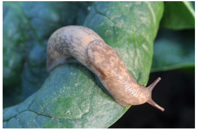
Abb. 6: Genetzte Ackerschnecke ( Deroceras reticulatum ) mit beige-grünlich gemustertem Körper.

Diese beige-grünliche, bis zu 5 cm lange Schneckenart mit bräunlichen Tupfen oder Mustern auf der Oberseite (Abb. 6) lebt in den Ackerflächen und bewegt sich etwa 1.5 m um ihr Versteck herum. Erwachsene Genetzte Ackerschnecken können Frostperioden unterirdisch überdauern und werden schon ab 1-2°C wieder aktiv.