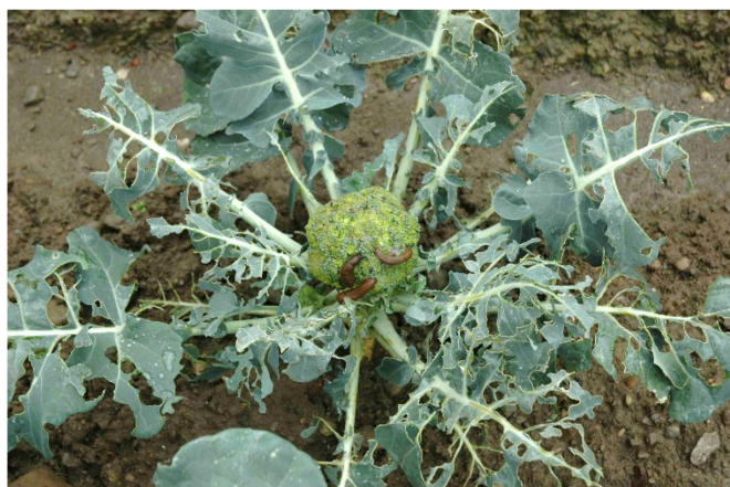
Abb. 1: Skelettierfrass durch Wegschnecken ( Arion sp.) an einer Broccoli-pflanze am Feldrand.

Befallssymptome von Schadschnecken treten in den Kulturen während der Vegetationsperiode häufig bei feuchten Bedingungen auf. Insbesondere am Feldrand sind abgefressene Keimlinge oder zerfressene Blätter (Abb. 1), garniert mit Schleimspuren (Abb. 2) oder mit wurmförmigem Kot (Abb. 3) zu finden.