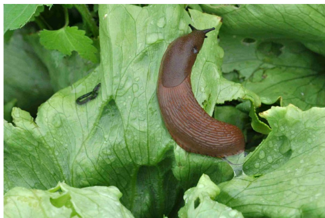
Abb. 3: Wegschnecke ( Arion sp.) mit gut sichtbarem Schleim am Körperende. Links ihr Kot in Wurmform.

bis schwarz sieht sie den grossen heimischen Roten und Schwarzen Wegschnecken ( Arion rufus , A. ater ) sehr ähnlich, die sie zunehmend verdrängt. Die Spanische Wegschnecke lebt mit Vorliebe im Feldsaum, hat aber einen Aktionsradius von bis zu 10 m und kann so entsprechend weit ins Feld vordringen.