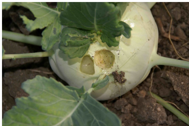
Abb. 2: Lochfrass an Knollen – garniert mit einer Schleimspur wie hier an Kohlrabi – ist typisch für Schneckenfrass.

Bei den Wegschnecken sind Vertreter der Gattung Arion von grosser Bedeutung (Abb. 3). Arion vulgaris , die Spanische Wegschnecke , breitet sich seit einigen Jahrzehnten über Europa aus und zählt inzwischen zu den dominierenden Schneckenarten im Schweizer Gemüsebau. Mit bis zu 10 cm Länge und einer variablen Färbung von orange, rot zu braun