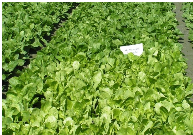
Foto 3: gli spinaci invernali non concimati con zolfo in primavera mostrano, nella parte anteriore dell'immagine, sintomi di carenza di zolfo.

In primavera, la carenza di zolfo si manifesta soprattutto nelle colture con elevate esigenze. Sintomi di carenza sono stati osservati anche in colture orticole con un fabbisogno di zolfo generalmente modesto, come gli spinaci invernali. È stato dimostrato che in questa coltura è possibile porre rimedio a questo problema mediante un'applicazione di circa 10 kg di zolfo puro per ettaro (immagine 3). In caso di colture orticole svernate, nonché di semine e piantagioni precoci sotto coperture, è generalmente necessario assicurarsi che con le prime applicazioni di concime venga fornita anche una quantità di zolfo adatta alla coltura.