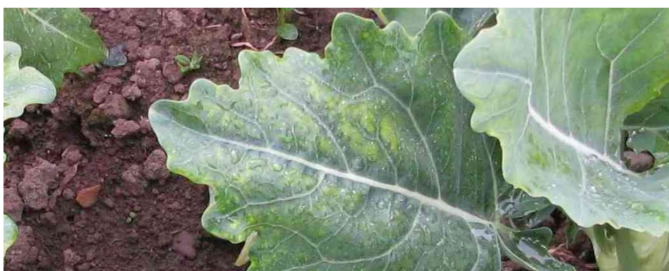
Foto 1: inizio carenza di zolfo su una foglia di cavolo rapa.

La netta riduzione del tenore di zolfo nei carburanti e nei combustibili ha contribuito in modo significativo alla riduzione dell'inquinamento atmosferico. A questo sviluppo molto positivo dal punto di vista ambientale si contrappone la riduzione dell'apporto di zolfo come nutriente per le piante nei terreni agricoli. Gli agricoltori si trovano, quindi, di fronte a una nuova sfida. Il fabbisogno di zolfo delle colture più esigenti non può più essere coperto solo dagli apporti ambientali e dalle fonti naturali. Per prevenire perdite di qualità e di resa dovute alla carenza di zolfo, è necessario prendere in considerazione l'uso di concimi contenenti zolfo, tenendo conto delle esigenze delle colture, delle caratteristiche del suolo, del clima, nonché della stagione.