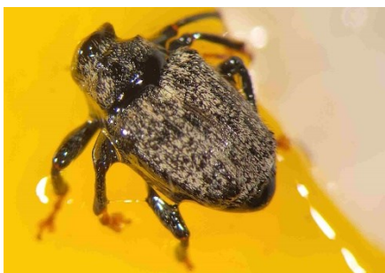
Foto 4: punteruolo degli steli dei cavoli su trappola gialla adesiva. Tipici sono le macchie bianche dietro lo scudo del collo e i piedini rosso ruggine (foto: 10 marzo 2025 di Agroscope).

Foto 3: schiusa delle uova deposte dalla cimice verde del riso ( Nezara viridula ) con giovani ninfe (N1). Chi l'anno scorso ha avuto un'infestazione di cimici verdi del riso nella serra, dovrebbe ora controllare regolarmente la presenza di cimici e deposizioni di uova negli ortaggi da frutto (foto: Agroscope).