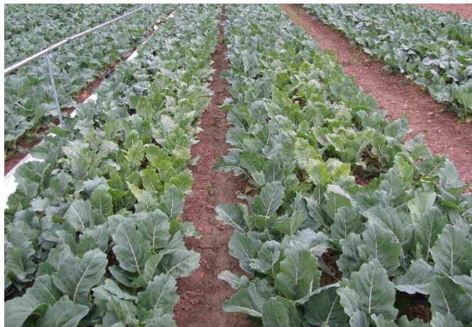
Foto 2: Nella zona centrale della coltura di cavolo rapa, non concimata con zolfo, sono visibili evidenti sintomi di clorosi fogliari provocate dalla carenza di zolfo.

Tra le colture orticole, le specie della famiglia delle Brassicaceae hanno esigenze particolarmente elevate di zolfo. Le brassicacee quali cavolo cappuccio, cavolfiore, broccoletto, cavolo riccio, cavolini di Bruxelles e cavolo rapa, che producono una grande quantità di biomassa, assorbono fino a 80 kg di zolfo puro per ettaro. Anche rape, ramolaccio, rapanelli e rucola dipendono da una maggiore disponibilità di zolfo nella zona radicale (immagine 2). Sono, inoltre, considerate bisognose di zolfo le specie della famiglia delle liliacee (cipolle, aglio, porro) e le leguminose (fagioli e piselli).