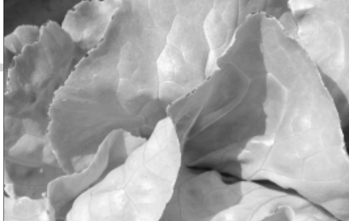
Abb. 2. Typisches Erscheinungsbild von Trockenrand.

Bezüglich des Kopftyps (geschlossen oder offen) ist eine Tendenz zu eher offenen Kopfformen (Abb. 5, s. S. 15) festzustellen: Matilda, Catarina, Sagess und Sunrise gehören zu dieser «offenen» Gruppe. Die Sorten MI RX