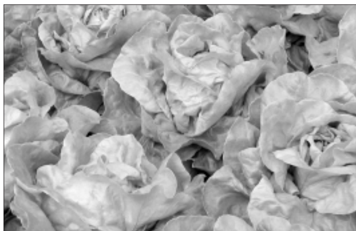
Fig. 5. Type de tête «ouverte», p. ex. la variété Sunrise. Abb. 5. «Offene» Kopftypen am Beispiel der Sorte Sunrise.

La vérification de la résistance au mildiou et au gros puceron de groseille ( Nasonovia ribisnigri ), appelé communément puceron de laitue, était prioritaire lors des essais variétaux. Ces deux propriétés sont tout particulièrement significatives pour la culture bio, car l'emploi de pesticides efficaces est limité. Les conditions météorologiques sont déterminantes pendant la culture pour savoir s'il faut compter avec une forte attaque de pucerons ou non. C'est pourquoi deux plantations ont été effectuées, soit la première plantation le 12 mai 2002 et la seconde le 11 juin 2002, afin d'analyser les attaques de pucerons et de mildiou. La sécurité de la production et l'aptitude à la vente sont également significatives. Des relevés ont été faits à ce sujet. La tendance à la montaison a été également saisie.