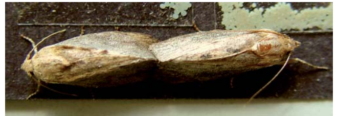
Copulation: femelle à droite et mâle à gauche

La femelle commence à pondre ses oeufs entre le 4ème et le 10ème jour après l'émergence du cocon [5]. C'est à la tombée de la nuit que la femelle cherche à pénétrer dans les ruches pour y pondre ses oeufs. Si la colonie est forte et qu'elle n'y parvient pas, elle dépose ses oeufs à l'extérieur dans les fentes du bois.