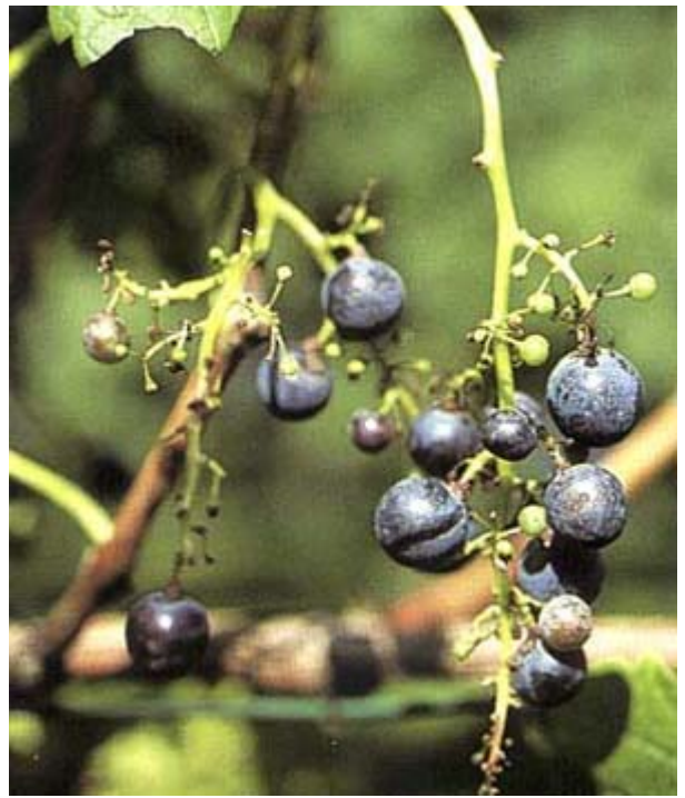
Grappes coulées (Merlot).

Elaboré par Agroscope RAC et FAW Wädenswil.