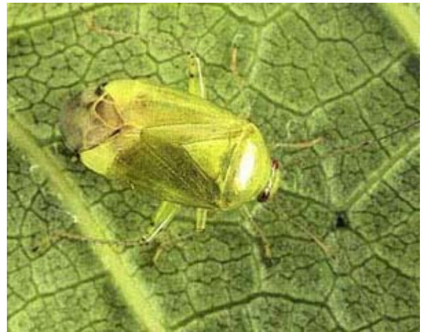
Adulte de la punaise verte de la vigne, Lygus spinolai (5 à 6 mm).

Les principaux dommages apparaissent sur les feuilles et les grappes. L'axe de la pousse est plus rarement