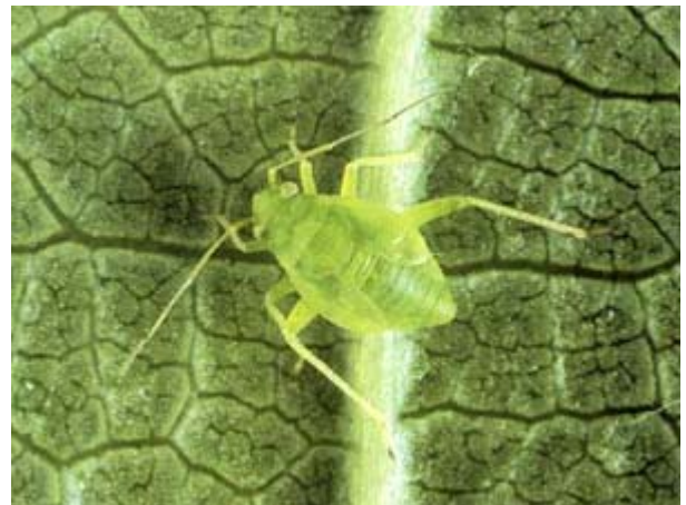
Larve du cinquième stade (nymph : 3,5 à 4 mm).