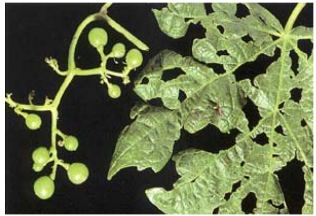
Grappe coulée et feuille trouée lacérée (Chasselas).

L'hétérogénéité et la gravité des attaques rendent très difficile l'établissement d'un seuil de tolérance. Si le foyer dépasse cinq cep, il est recommandé de marquer les zones attaquées en saison et de prévoir, l'année suivante, un traitement de débourement au stade D, limité à ces zones. Dans l'état actuel des attaques en Suisse, il n'est en général pas nécessaire de répéter le traitement ou de recourir à un insecticide de longue durée d'action.