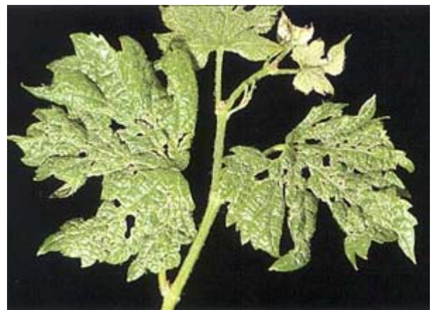
Jeunes feuilles avec ponctuations brunes et trous (Merlot).