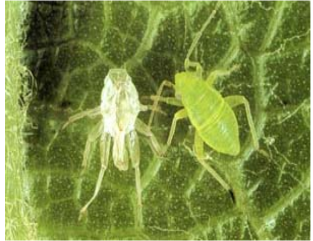
Larve du deuxième stade avec son exuvie (1,5 à 1,6 mm).