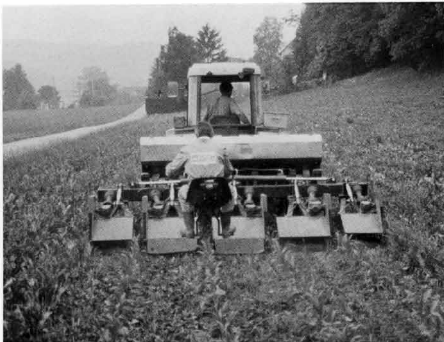
Abb. 5: Die Streifenfrässaat in Wiesen in Verbindung mit dem Zwischenreihenmulchschnitt ermöglicht einen hervorragenden Schutz gegen Erosion und Nitratauswaschung. Mulchen kommt den Landwirt leicht teurer zu stehen als das Hacken oder eine Flächenspritzung.