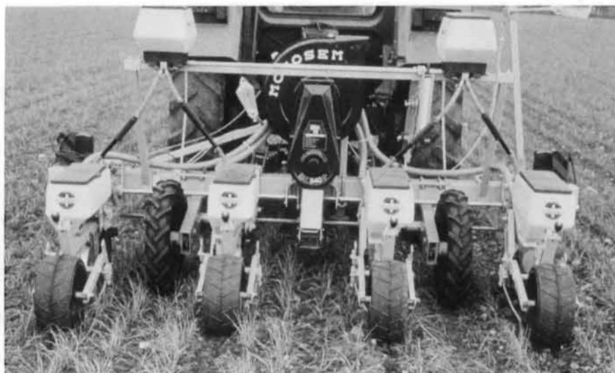
Abb. 4: Die Schachtsaat (Mulchsaat ohne Saatbettbereitung) in Grünschnittroggen hat den Vorteil, dass Verstopfungen der Säorgane weitgehend vermieden werden können. Sie stellt hohe Anforderungen an die Bodenstruktur und an die Qualität der Saatgutablage.