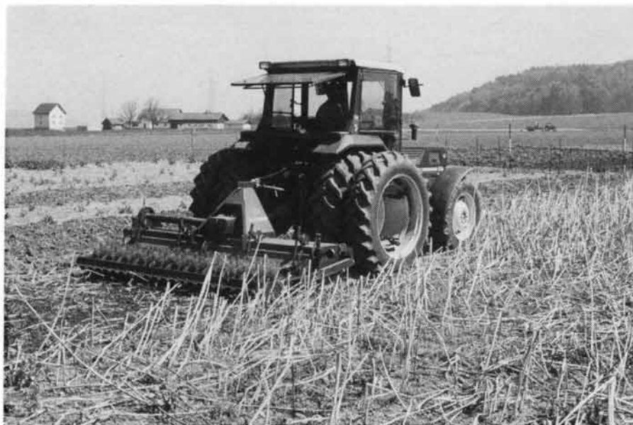
Abb. 3: Die Mulchsaat mit ganzflächiger Bodenbearbeitung (hier mit Zinkenrotor in Sonnenblumen) ist eine kostengünstige Variante, die keine speziellen Maschinen erfordert.

In Tabelle 1 ist die Auswahl der verschiedenen Geräte und Maschinen nach deren Grösse und Einsatzweise (eigenes Gerät, Lohnarbeit, Miete) dargestellt. Die Berechnungen basieren auf den Werten des FAT-Berichts 425 «Maschinenkosten 1993» (Ammann 1992) und «Richtansätzen 1992» des