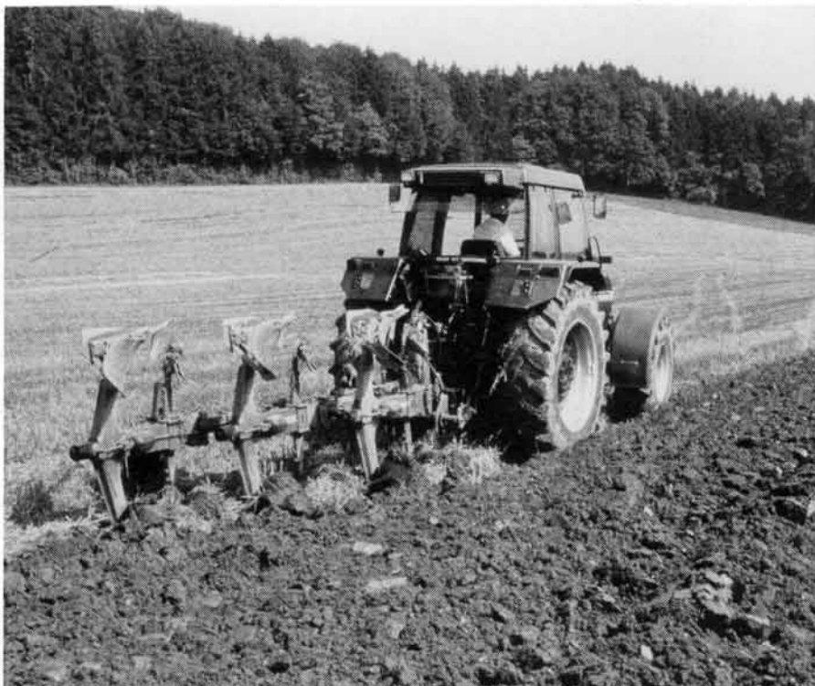
Abb. 2: Pflügen schafft einen «sauberen Tisch», lockert Bodenverdichtungen intensiv und bekämpft störende Verunkrautung effektiv. Der Pflug ist aber der Hauptverursacher der Bodenerosion im Maisanbau.