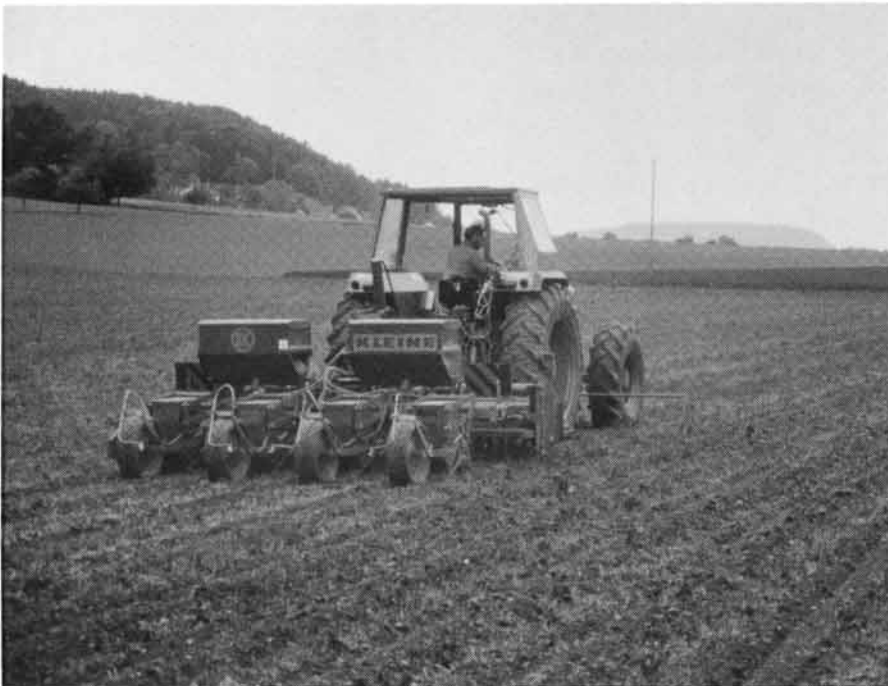
Abb. 1: Falls der Landwirt seine Arbeitsstunden mit Fr. 21.-/h verrechnet, so kommt ihn die Streifenfrässaat durch den Lohnunternehmer nicht teurer zu stehen als die eigene konventionelle Bodenbearbeitung mit dem Pflug.

werden. Wird der Aufwand für die Bodenbearbeitung reduziert, so kommt eine Mulchsaat mit dem Anbau einer Gründüngung nicht teurer zu stehen als der konventionelle Maisanbau mit dem Pflug. Die Streifenfrässaat durch den Lohnunternehmer erzielt bei der Annahme von gleichen Ertragsniveaus denselben Deckungsbeitrag wie der eigene Pflugeinsatz.