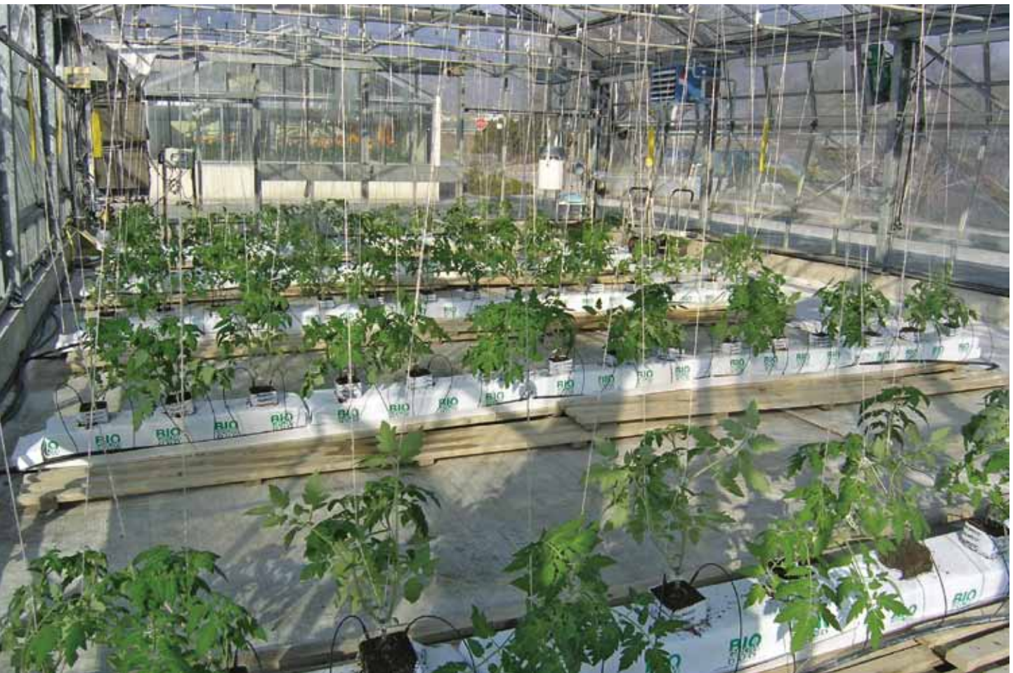
Mise en place de l'essai dans la serre témoin, année 2008.