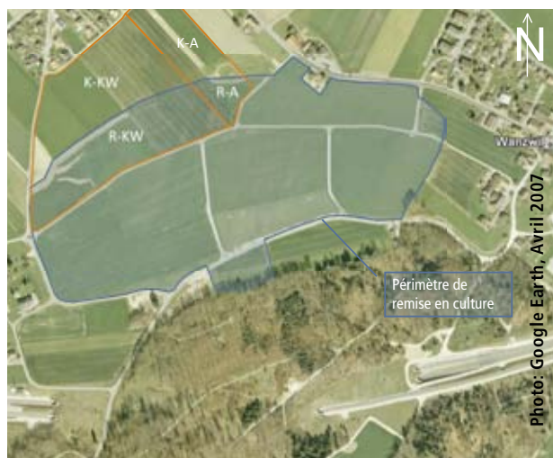
Figure 2 | Ancienne décharge Schacht près de Wanzwil avec le périmètre de reconstitution encadré en bleu et les quatre parcelles d'étude encadrées en rouge (K-A = sol arable témoin; K-KW = prairie artificielle témoin; R-A = sol arable reconstitué; R-KW = prairie artificielle reconstituée). Au bas de l'image apparaît la nouvelle ligne de train.

pâture ont été à nouveau permises. Les surfaces sont cultivées maintenant depuis huit ans et seront bientôt restituées à leurs propriétaires pour une exploitation normale.