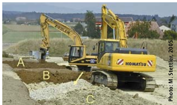
Figure 1 | Reconstitution des sols agricoles sur la décharge de la sortie de tunnel à Schacht près de Wanzwil: A = sol supérieur; B = sous-sol; C = remblai nivelé avec des rigoles de drainage (flèche).

Résumé Rail 2000 entre Mattstetten et Rothrist a été l'un des premiers grands chantiers où les directives de protection du sol, établies il y a une dizaine d'années, ont été rigoureusement suivies dans les phases de planification, de réalisation et de remise en culture, sous la surveillance de spécialistes de la protection du sol. Le but de l'étude présentée ici était d'apprécier l'efficacité de ces efforts au moyen de mesures simples couvrant le plus de surface possible. La résistance du sol a été mesurée avec un pénétromètre sur des surfaces reconstituées après la remise en culture ainsi que des surfaces à sol naturel. L'étude a porté sur deux sites (Wanzwil et Hersiwil) et deux types d'utilisation (prairie artificielle et culture de céréales), en tenant compte de l'humidité du sol. Les résultats montrent qu'après sept années de remise en culture, les sols reconstitués ne diffèrent pas des sols naturels avoisinants en ce qui concerne la résistance à la pénétration. Les mesures de protection ont donc empêché une compaction du sol. Les sols reconstitués présentaient même une résistance à la pénétration légèrement plus faible au niveau de la semelle de labour (25 – 35 cm). Cet avantage devrait être maintenu par des techniques culturales sans labour ou l'utilisation d'une charrue on-land.