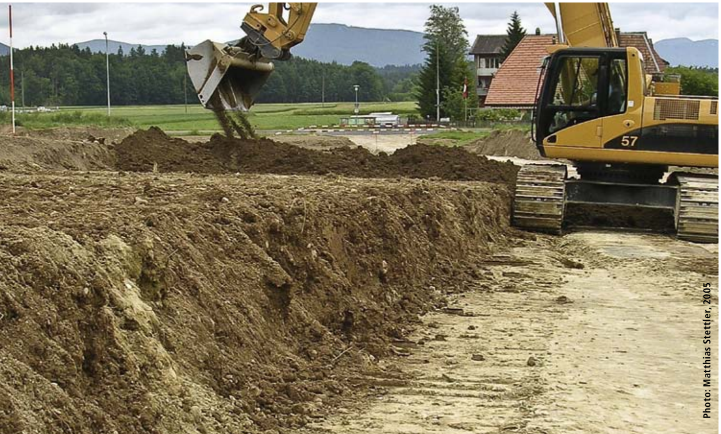
Reconstitution du sol: déversement de la terre superficielle sur le sous-sol préalablement préparé.