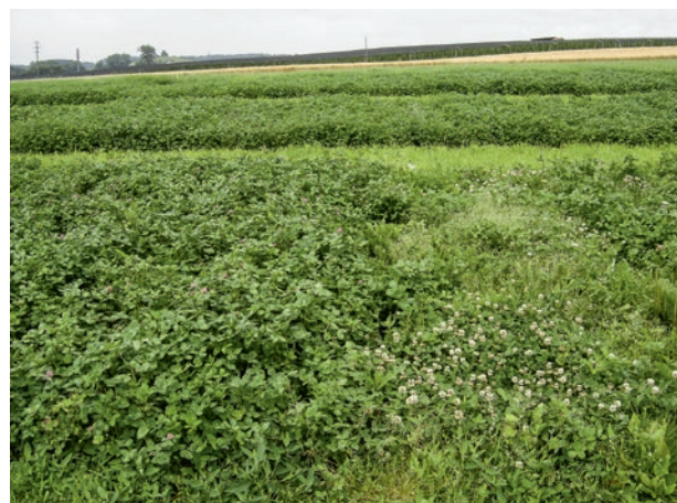
Figure 3 | Essai variétal avec du trèfle violet: première pousse durant la deuxième année d'exploitation principale. La différence de qualité du peuplement est évidente.

Une nouvelle variété est inscrite dans la «Liste des variétés recommandées» (Frick et al. 2012) si sa valeur d'indice global est d'au moins 0,20 points au-dessous de la moyenne des variétés déjà recommandées (témoin). Une variété déjà recommandée est éliminée si son indice global est dépassé de plus de 0,20 points la moyenne des variétés témoins (valeur plus élevée = propriétés plus mauvaises).