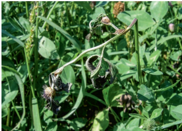
Figure 2 | Anthracnose du sud ( Colletotrichum trifolii ) sur du trèfle violet. Cette maladie importante peut avoir une grande influence sur la persistance des variétés touchées.

mononétine, un phytoestrogène (Schubiger et Lehmann 1994b). Comme on ne peut exclure des troubles de la fertilité chez les animaux qui reçoivent des rations de fourrage riches en trèfle violet en continu, les variétés qui contiennent peu de formononétine sont particulièrement recherchées.