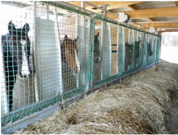
Abbildung 1: geschlossene Sparraufe

Haylagevorlage um 10:30 h, 13:30 h und 16:30 h während 30 Minuten durchgeführt. Das Futter wurde abgewogen auf einem Tuch unter oder über dem Netz vorgelegt und nach 30 Minuten Fressdauer zurückgewogen. Es wurden die aufgenommene Futtermenge pro Zeiteinheit (30 Minuten), die Anzahl von „Heu / Haylage ohne Netz oder durch das Netz zupfen“, sowie die Anzahl Kauschläge erfasst (vgl. Abb 2).