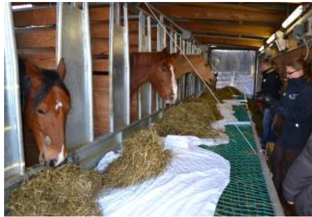
Abbildung 2: 3 kg abgewogene Haylage, Futteraufnahme „ohne Netz“