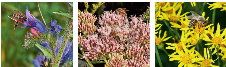
Figure 1 : Abeilles sur la vipérine commune, l'eupatoire à feuilles de chanvre et le séneçon jacobée.