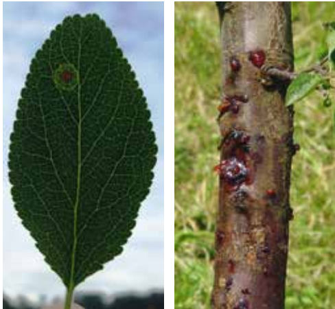
Tache nécrotique sur feuille. Ecorce attaquée.

Symptômes – La bactérie Pseudomonas peut se trouver sur toutes les espèces d'arbres à noyau. Les feuilles infectées montrent des taches nécrotiques d'aspect huileux entourées d'un anneau jaune. Les boutons floraux contaminés dépérissent. L'écorce des arbres fortement attaqués est décolorée, molle et déprimée, avec des fissures et de la gommose. Des branches entières et même des arbres peuvent dépérir.