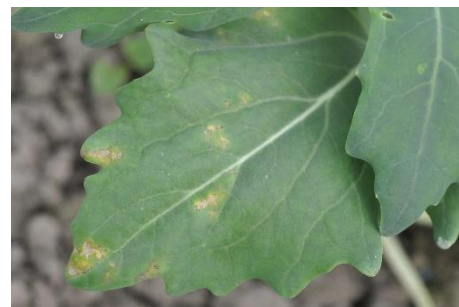
Photo 3 : Symptôme d'atteinte de mildiou à la face supérieure d'une feuille de colrave. La culture en question se trouve dans un tunnel voisin d'un champ de colza.