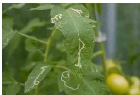
Photo 7 : Galeries larvaires de mouches Liriomyza dans des feuilles de tomates (photo : C. Sauer, Agroscope). Ces ravageurs sont susceptibles d'attaquer dès maintenant !

Les substances actives autorisées pour la lutte contre la mouche mineuse du poireau sont : lambda-cyhalothrine (divers produits ; poireau, ail, oignons : délai d'attente 2 semaines ; herbes condimentaires : délai d'attente 1 semaine) ou spinosad (AudiENZ, BIOHOP AudiENZ ; poireau, oignons, ciboulette : délai d'attente 1 semaine).