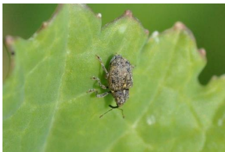
Photo 1 : Charançon de la tige du chou sur une feuille de colza. Actuellement, le risque d'attaques s'étend aux radis, radis longs, colraves et d'autres espèces de brassicacées.

Actuellement, le danger d'attaques du charançon de la tige du chou ( Ceutorhynchus pallidactylus ) ou de la mouche blanche du chou ( Aleyrodes proletella ) s'intensifie fortement dans les cultures de choux installées à proximité de cultures de colza. De plus, la pression d'infection du mildiou des brassicacées ( Peronospora parasitica ) peut aussi augmenter du fait que les deux cultures sont sujettes à cette maladie. Il est hautement recommandé de contrôler les parcelles à risque.