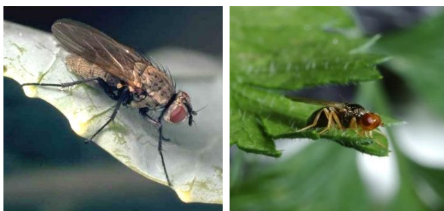
Photo 1 : Adulte de la mouche du chou Photo 2 : Adulte de la mouche de la carotte.

Les mouches du chou et de la carotte sont surveillées au moyen de pièges dans de nombreuses régions de cultures maraîchères de Suisse alémanique, ce qui permet de connaître l'activité de vol des adultes. C'est particulièrement chez les mouches des légumes qu'il importe de faire un usage ciblé (c'est-à-dire exclusivement lorsque le danger d'attaque est avéré) des rares substances actives encore autorisées.