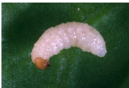
Photo 2 : Il faut donc s'attendre à l'apparition de larves du charançon dans les cultures attaquées.