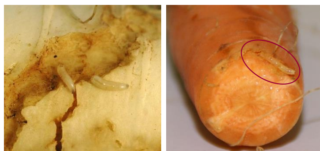
Photo 3 : Larves de la mouche du chou dans leur galerie de nourrissage sur radis long. Photo 4 : Larve de la mouche de la carotte en train de forer dans une carotte.