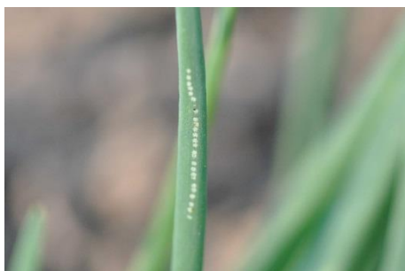
Photo 6 : Points de nutrition de la mouche mineuse du poireau sur une feuille de ciboulette.

A l'inverse, l'efficacité des granulés à base de phosphate III ferrique est maximale par forte humidité. Lors d'épisodes de fortes précipitations, leur épandage doit toutefois être répété.