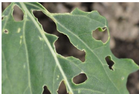
Photo 5 : Dégâts causés par des limaces sur une plante en bordure de tunnel.