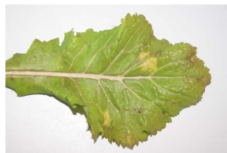
Photo 4 : Parmi les échantillons prélevés au hasard dans le champ de colza mentionné ci-dessus, on a trouvé une feuille aussi atteinte de mildiou.