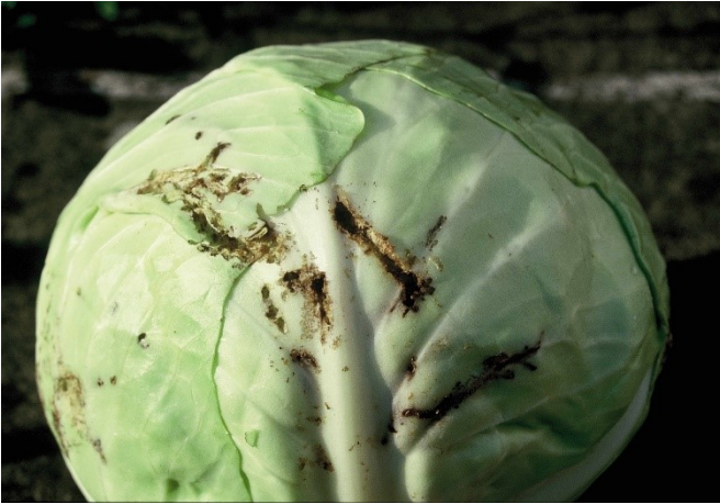
Abb. 6: Frassgänge der Larven der Kleinen Kohlflyge an einem Weisskohlkopf.