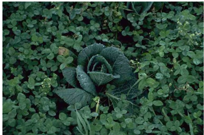
Abb. 11: Kleeuntersaat in einer Wirzkultur.

Die Untersaat mit Erd-Klee ( Trifolium subterraneum cv. Claire) ist eine weitere Massnahme zur Bekämpfung der Kleinen Kohlflyge (Abb. 11). Dabei wird die Wirtspflanzen-suche der Kleinen Kohlflyge erschwert, indem das spezifische Verhaltensmuster zur Wirtspflanzenfindung gestört wird. Erfolgt die Landung auf einer gesäten Erd-Klee-Pflanze, legen die Weibchen keine Eier ab und setzen die Suche fort. Mit dieser Methode konnte in Versuchen eine Befallsreduktion von 70-80% erzielt werden 21 . Erd-Klee ist für die Untersaat gut geeignet, da die Konkurrenz zur Hauptkultur bei regelmässigem Stutzen zu vernachlässigen ist 21 .