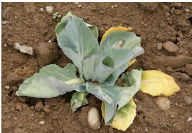
Abb. 2: Durch Kohlflygen-Larven stark geschädigte junge Kohlpflanze.

Pro Jahr treten drei vollständige Generationen der Kleinen Kohlflyge auf, allerdings wird in den letzten Jahren fast regelmässig eine schwache vierte Generation beobachtet.