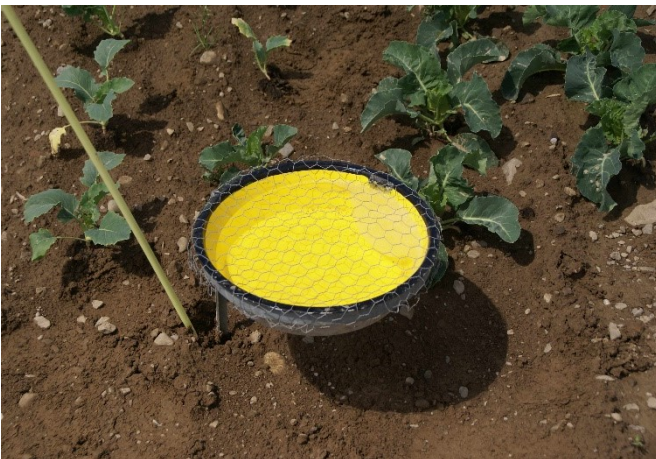
Abb. 8: Gelbe Wasserfalle zur Überwachung der Flugaktivität der Kleinen Kohlflyge.