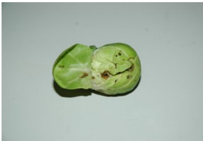
Abb. 5: Röschen von Rosenkohl mit Frassschäden der Kleinen Kohlflyge (Foto: H.P. Buser, Agroscope).