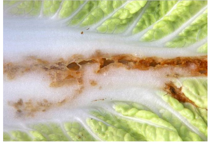
Abb. 7: Frassgang der Larven der Kleinen Kohlflyge an einem Chinakohlblatt (Foto: U. Vogler, Agroscope).