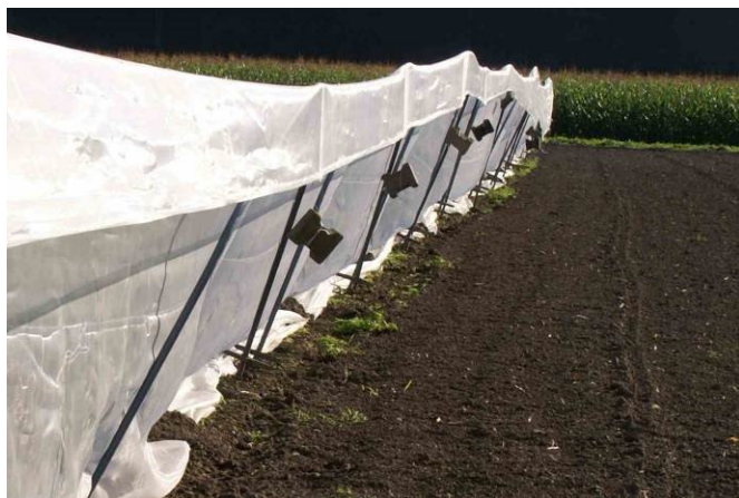
Abb. 10: Vertikaler Insektenschutzzaun zum Abhalten der einfliegenden Gemüsefliegen.

Eine weitere alternative Bekämpfungsmöglichkeit stellt der Einsatz von vertikalen Schutzzaunen dar 17,18,19 . In Versuchen wurden Schutzzaune mit einer Höhe von 1.35 m bis 1.80 m getestet (Abb. 10). Vorteilhaft dabei ist, dass bei Kulturmassnahmen ein geringer arbeitstechnischer Mehraufwand entsteht, weil sich der Zaun öffnen lässt. Zudem sind die Investitionskosten vor allem bei grossen Flächen geringer als beim Einsatz von Netzen 20 . Um den Wirkungsgrad und die Umsetzbarkeit in der Praxis beurteilen zu können, müssen noch weitere Untersuchungen durchgeführt werden.