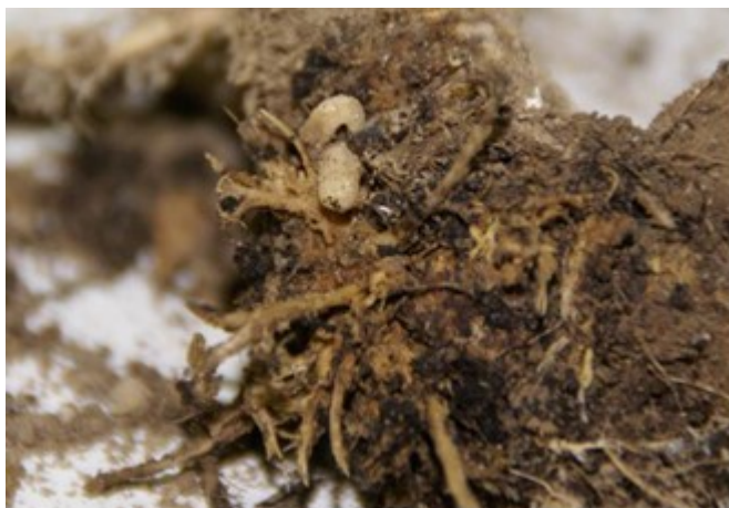
Abb. 3: Frassschäden an den Wurzeln einer Kohlpflanze mit Larven der Kleinen Kohlflyge (Foto: C. Sauer, Agroscope).