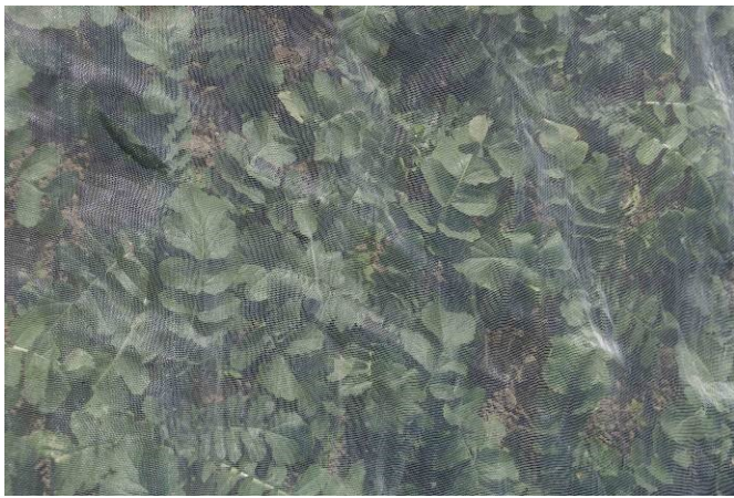
Abb. 9: Kulturschutznetz auf einer Rettichkultur zum Abhalten der Kohlflygen.

Beim Einsatz von Kulturschutznetzen sind folgende Aspekte zu beachten 16 :