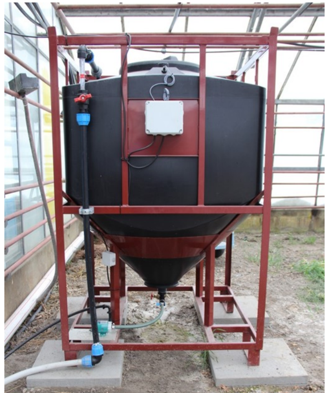
Abbildung 6: Sandfilter für die langsame Filtration.

Da die meisten Desinfektionsmethoden auf einer Oxidation beruhen, wird während des Desinfektionsprozesses ein Teil der vorhandenen Chelatkomplexe zerstört. Die in diesen Komplexen gebundenen Metalle werden ausgefällt. Die Lösung muss deshalb nach der Desinfektion filtriert und die Injektionsdosis der zerstörten Elemente erhöht werden.