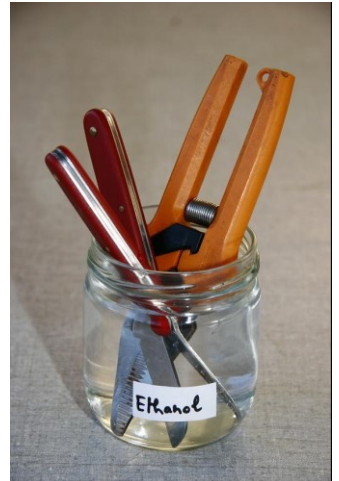
Abbildung 5: Desinfektion von Werkzeug. Um Wartezeiten zu vermeiden, wird empfohlen mehrere Werkzeug-Sets zu verwenden.