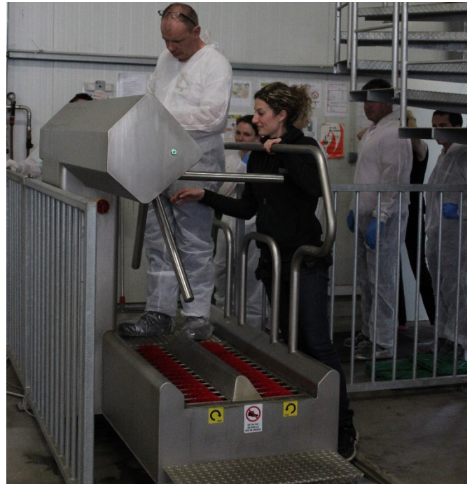
Abbildung 3: Desinfektion von Händen und Schuhen vor dem Betreten des Betriebs. Tragen von Schutzkittel, -hose und Überschuh.

Ausleihen von Material und Maschinen aus anderen Betrieben soll vermieden werden. Wenn trotzdem Geräte und Maschinen ausgeliehen werden, müssen diese vor und nach dem Einsatz komplett desinfiziert werden. Auch Import- und Abpackzentren können Urheber eines Befalls namentlich mit Schadinsekten (z.B. Tuta absoluta ) sein.