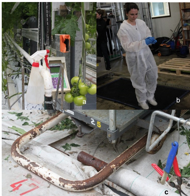
Abbildung 2: a) Desinfektionsmittel für Hände und Werkzeug b) korrekt ausgerüstete Besucherin c) Werkzeug, das für die Verwendung in einer einzelnen Linie vorgesehen ist

Im Sinne weiterer Prävention sollen Anbauflächen von Schmutz und Unkraut freigehalten werden .