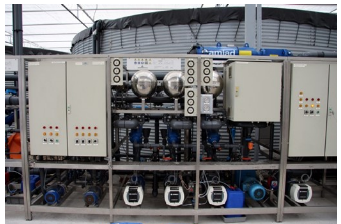
Abbildung 7: System zur Desinfektion des Wassers mit UV-Strahlung.