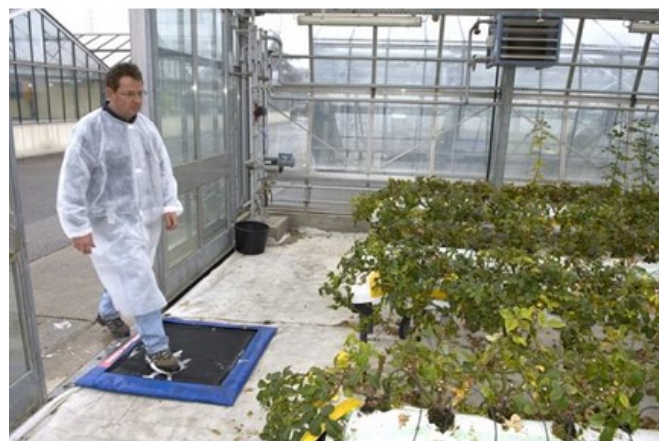
Abbildung 1: Schuh-Desinfektionsmatte beim Eingang des Gewächshauses. Die Lösung muss regelmässig gewechselt werden.

Am Eingang jedes Gewächshauses oder Gewächshausabteils soll eine Desinfektionsmatte für Schuhe eingerichtet werden (Abb. 1). Es muss eine ausreichende Menge Wasser und ein wirksames Desinfektionsmittel enthalten (siehe Kasten). Die Desinfektionsmatte soll regelmässig gereinigt und die Desinfektionslösung gemäss der Gebrauchsanweisung gewechselt werden. Die Desinfektionsmatte muss immer feucht sein. Wenn organische Ablagerungen (Erde, Pflanzenreste, etc.) die Desinfektionsmatte verschmutzen, muss sie gereinigt und die Lösung erneuert werden.