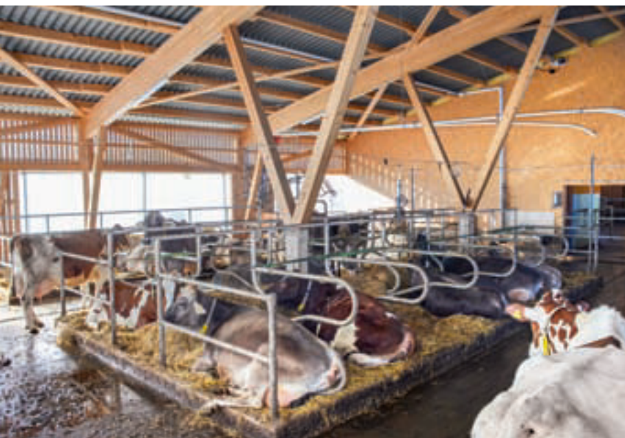
Les vaches apprécient la lumière et l'air frais dans l'étable.

Au-delà de 20°C, les vaches doivent évacuer l'excès de chaleur, par exemple en se tenant debout dans des endroits plus frais, plus exposés au vent dans l'étable, en transpirant ou en respirant plus rapidement. Des températures trop élevées dans l'étable pendant la saison chaude ou un manque d'air frais nuisent au bien-être des animaux. Les vaches préfèrent une étable à climat extérieur avec beaucoup d'air frais en été et en hiver. Elles ont d'autre part besoin d'être protégées contre le vent en hiver.