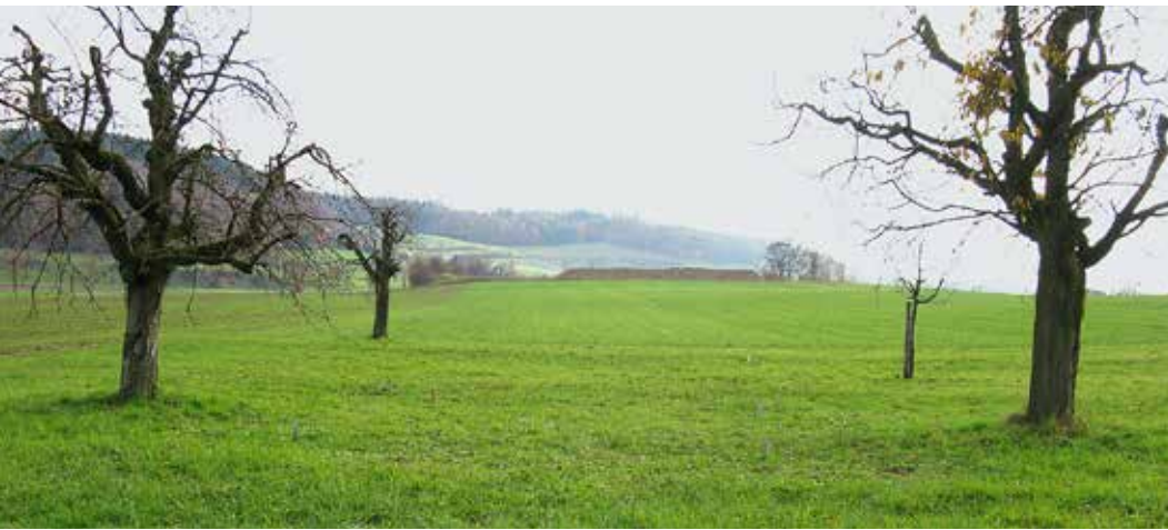
Abb. 1 | Am meisten Mykorrhiza-Pilzarten weisen Naturwiesen auf, danach folgen schonend bearbeitete, vielfältig bebaute Ackerböden mit Kunstwiesenanteil: Boden-Dauerbeobachtungsstandort Niederösch, Kanton Bern (im Vordergrund die wenig intensiv genutzte Naturwiese, daran anschliessend die Ackerfläche, 2009 mit einer Kunstwiese).

Auskünfte: Claudia Maurer, E-Mail: claudia.maurer@vol.be.ch