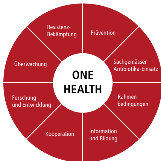
Abb. 2 | Die Nationale Strategie gegen Antibiotikaresistenzen ist in acht Handlungsfeldern aktiv.