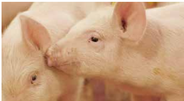
Abb.1 | Ferkel sind gesünder dank Tanninen.