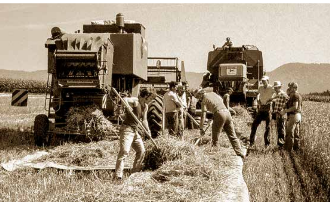
Mähreschertests während der 1970er-Jahre: Forschung erfolgte damals personalintensiv und ohne digitale Hilfsmittel.