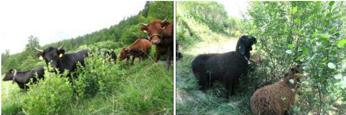
Abb. 1: Dexter-Rinder und Engadiner Schafe auf einer mit Grünerle bewachsenen Alpweide (angepasst aus Zehnder et al., 2016b).

wurde in Koppeln mit einem Deckungsanteil der Grünerle zwischen 0% (keine), 20-30% (tiefe), 40-60% (mittlere) und 80% (hohe Erlendeckung) eingeteilt. Jede der vier Rindergruppen beweidete jeweils eine Grünerlendeckungsstufe. Gleiches galt für die Schafe auf anderen Teilkoppeln. Die Futtererträge wurden mittels Weideausschlusskörben mit 1.2 \times 1.2 m 2 Grundfläche an insgesamt 20 Positionen in unterschiedlichen Vegetationstypen der Weideflächen erhoben. Die verdauliche organische Substanz im Futter wurde nach Tilley und Terry (1963) bestimmt. Während der Beweidung wurden die Tiere beobachtet und alle 10 Tage gewogen, um den Tageszuwachs zu bestimmen. Zum Abschluss des Versuches wurden die Tiere geschlachtet und die Schlachtkörperausbeute bestimmt. Nach 21 Tagen Reifung wurde die Fleischqualität am Longissimus thoracis erhoben. Die Daten wurden mittels gemischter linearer Modelle analysiert.