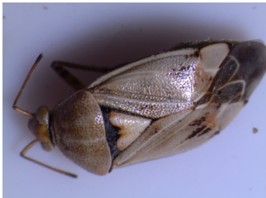
Lygus sp. à Conthey en 2019.

Aucun dégât n'a été constaté sur la parcelle d' Artemisia vallesiaca en 2019.