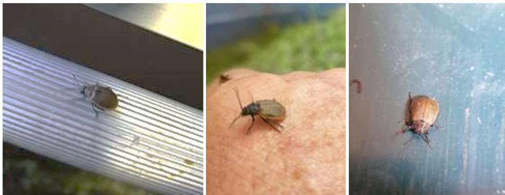
Galéruques à Orvin (BE). Photos J.-M. Auroi, 2019

Les insectes n'ont pas pu être déterminés avec exactitude sur la base des photos qui nous sont parvenues. Il s'agit à l'évidence de coléoptères de la famille des Chrysomelidae de la sous famille des Galerucinae . La présence de plusieurs espèces est évoquée.