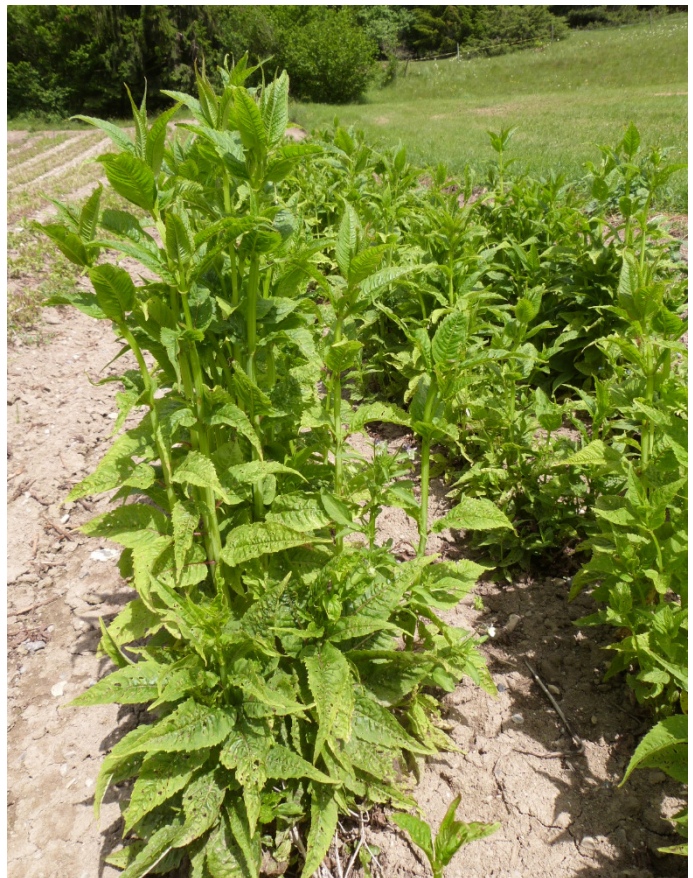
Dégâts de Longitarsus sur Monarda didyma à Ayent