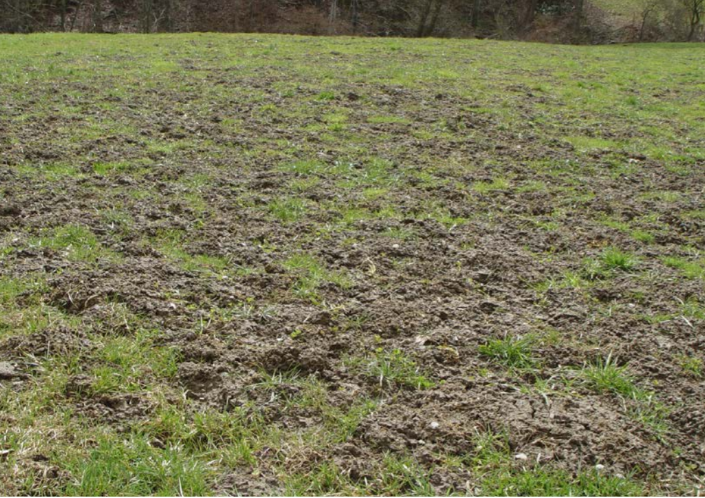
Hier haben die Mäuse einen Totalschaden angerichtet. Der Bestand ist dezimiert und die Bodenoberfläche verschmutzt und kann so nicht mehr genutzt werden.