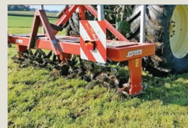
72 Werkzeuge wirken bis 20 cm Tiefe und stören die Mäuse.

Regelmässige Störungen durch Bodenbearbeitung drosseln die Populationsentwicklung der Mäuse (siehe Haupttext). In Dauergrünland ohne Fruchtwechsel und Bodenbearbeitung zeigen Geräte für die Grasnarbenbelüftung- und Bodenlockerung in der Praxis einen starken Bekämpfungseffekt. Gemäss Landwirt Jürg Schönholzer aus Sulgen TG konnte er so einen grossen Mäusedruck reduzieren. Er setzt einen Grasnarbenbelüfter von Evers ein. Ohne die Bodenoberfläche aufzureissen, wirken die 72 Arbeitswerkzeuge bis 20 cm tief im Untergrund und stören Mäuse und deren Bauten. In Kombination mit einem Übersaat-Gerät von Gütler konnte er den Mäusedruck reduzieren und den Futterertrag in Qualität und Menge verbessern.