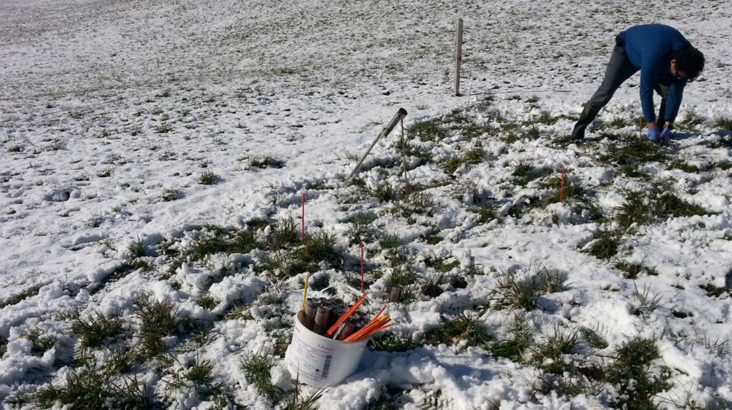
Mäusefang kennt keine Saison. In jeder Jahreszeit können Mäuse gefangen werden. Am effizientesten ist es zu Vegetationsbeginn, wenn die Populationen noch klein sind.