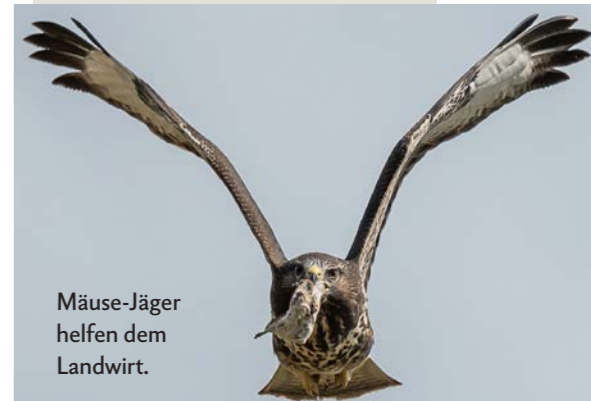
Mäuse-Jäger helfen dem Landwirt.