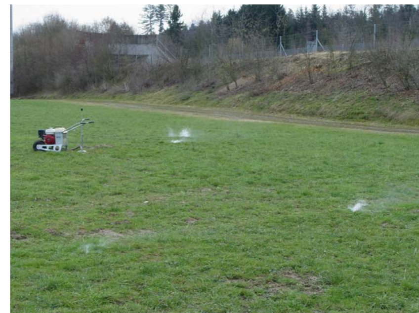
Mit dem Benzinapparatvergas erkennt man an den Stellen, wo die Abgase aus dem Boden treten, wie weitläufig ein Schermausgang angelegt ist.

Die Schermäuse kommen auch für kurze Augenblicke an die Oberfläche, um Grünzeug zu ernten. Sie ziehen die abgebissenen Stängel in ihre Gänge runter und verschliessen das Loch sofort wieder. Ihre Verweildauer auf der Oberfläche dauert jeweils höchstens 30 Sekunden. Ansitzenden Greifvögeln oder auch Graureihern oder Störchen reicht diese kurze Zeitspanne aus, um sich die Beute zu schnappen.