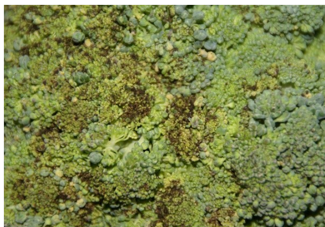
Figures 7 et 8: Attaque d' Alternaria sur une inflorescence de brocoli.