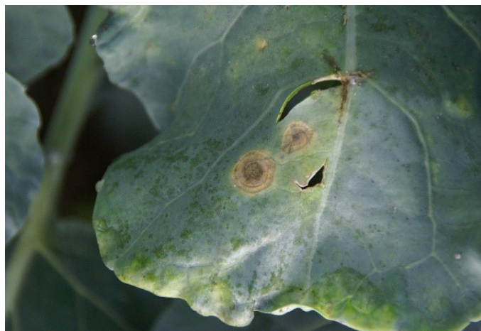
Fig. 2: Les anneaux concentriques sont typiques d'une attaque d' Alternaria.

De nombreuses espèces d' Alternaria produisent des toxines, qui pénètrent les tissus encore sains autour des taches foliaires et les décolorent. C'est pourquoi les taches d'alternariose sont souvent entourées d'une zone jaunâtre 4 (fig. 5). Avec le temps, le centre des tissus atteints devient mince et parcheminé, puis il se dessèche et peut tomber. La feuille est alors criblée de trous donnant l'apparence d'une salve de grenaille 2 (fig. 6).