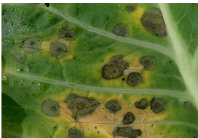
Fig. 5 : Plante de chou atteinte d'alternariose, avec le tissu jauni autour des taches par l'effet des toxines.