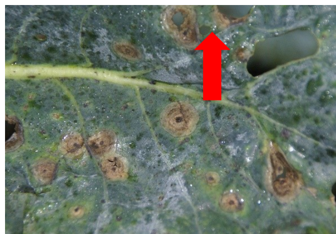
Fig. 6 : Les tissus desséchés se détachent au centre des taches d'alternariose. Il en résulte des trous donnant aux feuilles un aspect criblé.

Si la maladie n'est pas arrêtée au feuillage proche, l'alternariose peut se répandre aussi sur les inflorescences de brocolis et de choux-fleurs et y produire des taches. Celles-ci se manifestent d'abord sous forme de taches punctiformes noirâtres (fig. 7 et 8). Le champignon tend à produire, sur les tissus malades des inflorescences, des spores vert sombre à noires visibles sous la loupe 6 .