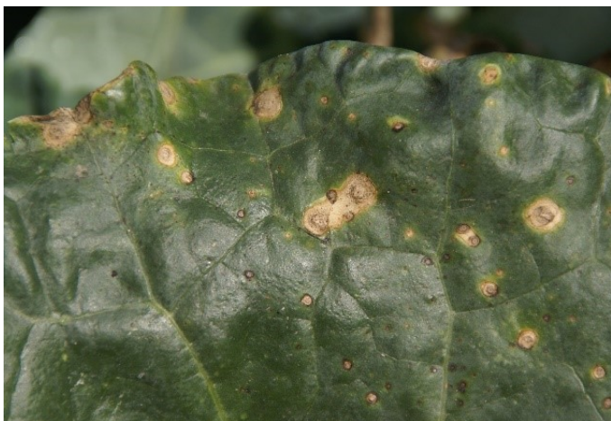
Fig. 1: Les premiers signes d'une attaque d' Alternaria sont de petites taches sombres.

Au début d'une infection sur le feuillage, on peut observer des taches sombres punctiformes (1–3 mm) 1 sur les feuilles âgées (fig. 1). Elles se développent ensuite en anneaux concentriques gris, noirs ou bruns et peuvent atteindre un diamètre de 12 mm 2 (fig. 2), évoquant l'image d'une cible 3,4 . Elles sont caractéristiques d' Alternaria spp. Cependant, leur forme peut être modifiée par les nervures qui limitent leur développement 1 (fig. 3). Ces taches sont souvent recouvertes d'un mince feutrage noir diffus, formé par les sporanges des champignons 4 (fig. 4).