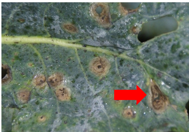
Fig. 3 : Limitées par les nervures, les taches foliaires d' Alternaria peuvent être déformées.