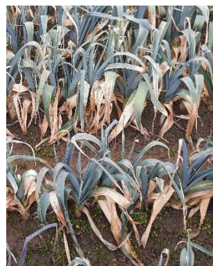
Photo 8: Le froid et le mildiou ( Phytophthora porri ) peuvent entraîner le dépérissement du feuillage des poireaux hivernés.