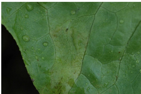
Photo 12: Jaunissements causés par le mildiou ( Bremia lactucae ) sur une laitue pommée.