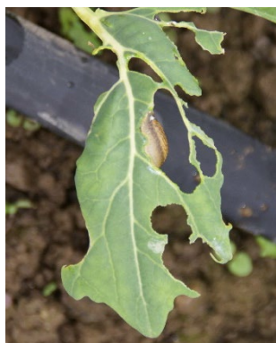
Photo 6: En tunnels, il faut maintenant surveiller la présence éventuelle de jeunes limaces (ici un Arion sp., photo: Agroscope).