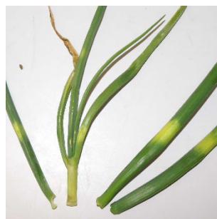
Photo 4: Plages jaune citron sur oignons d'hiver, supposées dues à un déséquilibre physiologique, tel qu'une carence en soufre.