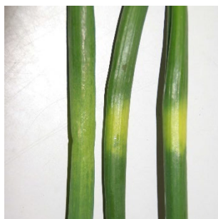
Photo 3: Feuilles jaunissantes avec suspicion de mildiou (à gauche) et feuilles avec plages jaune citron supposées dues à un déséquilibre physiologique (au centre et à droite).