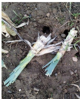
Photo 7: Les campagnols se font aussi menaçants. On a constaté des dégâts sur poireaux hivernés et sur herbes aromatiques.