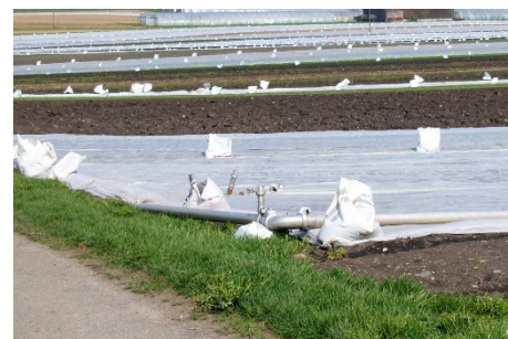
Photo 1: Il importe de bien fixer les voiles en prévision des coups de vent.

En cas d'annonce de gel nocturne il faut donc, si possible, attendre le soir avant de couvrir la culture de voiles protecteurs, afin qu'elle ait eu le temps de se ressuyer.