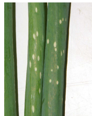
Photo 9: Les taches blanches du botrytis de l'oignon ( Botrytis squamosa ) se répandent actuellement sur oignons à botteler.