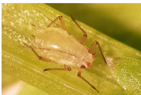
Photo 10: Puceron de l'échalote ( Myzus ascalonicus ) sur coriandre.