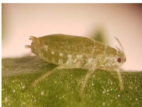
Photo 11: Puceron du saule ( Cavariella aegopodii ) sur persil. Caractéristique typique de cette espèce, le double appendice caudal à l'abdomen (photo: Agroscope).

Pour lutter contre les pucerons dans les cultures de salades pommées sous serre , on obtiendra une meilleure protection du jeune feuillage avec des substances actives systémiques : spirotétramate (Movento SC ; délai d'attente 2 semaines), ou un des néonicotinoïdes suivants : acétamipride (divers produits ; délai d'attente 2 semaines) ou thiamethoxam (Actara, Flagship ; délai d'attente 1 semaine). BiO : l'azadirachtine A (divers produits) est partiellement systémique et peut être utilisée sur salades pommées avec un délai d'attente d'une semaine.