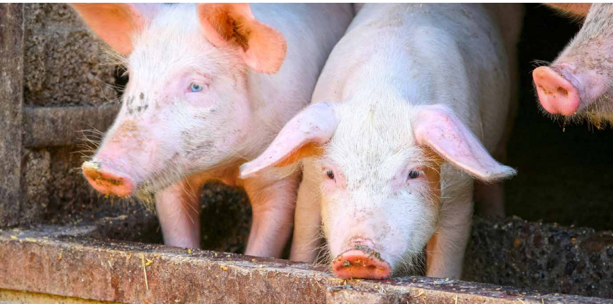
Schweine sind wichtige Verwerter von Lebensmittel-Nebenprodukten.

https://doi.org/10.34776/afs11-238 Publikationsdatum: 24. November 2020