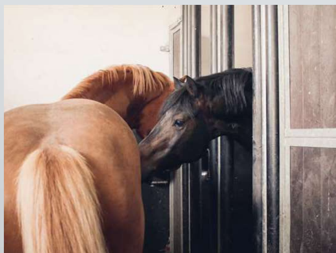
Fig. 1: La paroi du « box social » permet aux équidés voisins d'avoir des interactions sociales avec du contact physique. (HNS)

Que ce soit pour la détention en groupe ou en box individuel, il existe des exigences légales pour la surface minimale de repos par cheval en fonction de sa taille au garrot. La hauteur minimale du plafond est déterminée par le cheval le plus grand du groupe. Une jument avec son poulain a droit à une surface de box d'au moins 30% plus grande. Lors de la mise en œuvre pratique, il faut garder à l'esprit que les prescriptions légales représentent des dimensions minimales absolues. Dans la mesure du possible, les chevaux devraient disposer de davantage d'espace. Lors de la détention en groupe, l'exiguïté de l'espace entraîne rapidement des conflits, ce qui augmente considérablement le stress et le risque