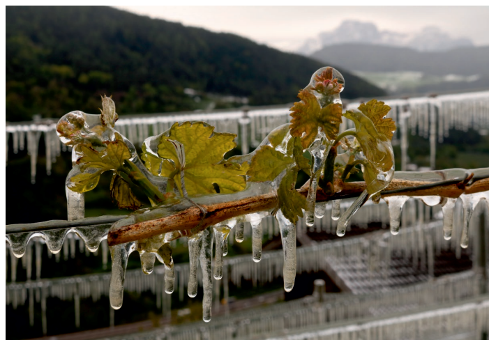
Fig. 30 : Lutte antigel par aspersion dans le Tyrol du Sud.

Chaque culture est affectée et réagit de manière différente aux conditions climatiques extrêmes ou changeantes, aussi bien au niveau de son cycle de croissance qu'au niveau de sa vulnérabilité à différents stades de son développement phénologique. Les risques de perte de rendement dépendent donc fortement de la probabilité qu'un extrême climatique coïncide avec une phase phénologique critique. Si l'augmentation des températures entraîne une plus forte précocité des phases critiques, le risque de dommages dus à un événement climatique extrême comme le gel tardif, augmente. Un thermomètre à la hausse peut, cependant, aussi avoir des effets bénéfiques. Si le développement phénologique prend de l'avance, la plante sera moins susceptible de souffrir d'un événement de chaleur ou de sécheresse extrême. Les stratégies d'adaptation pour l'agriculture sont donc multiples. La sélection de variétés plus précoces en particulier pourrait avoir un impact favorable sur la stabilité des rendements.