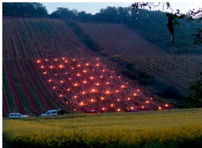
Fig. 31 : Lutte contre le gel tardif à l'aide de bougies antigel dans la région viticole allemande de Nahe.