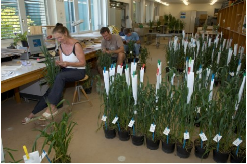
Pour le blé de printemps, ces deux générations sont réalisées en hiver au Chili