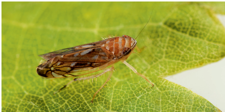
Scaphoideus titanus .