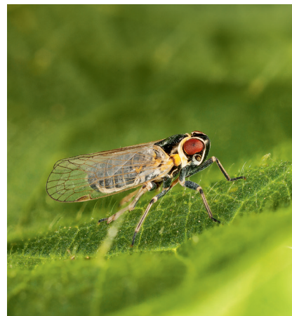
Hyalesthes obsoletus .