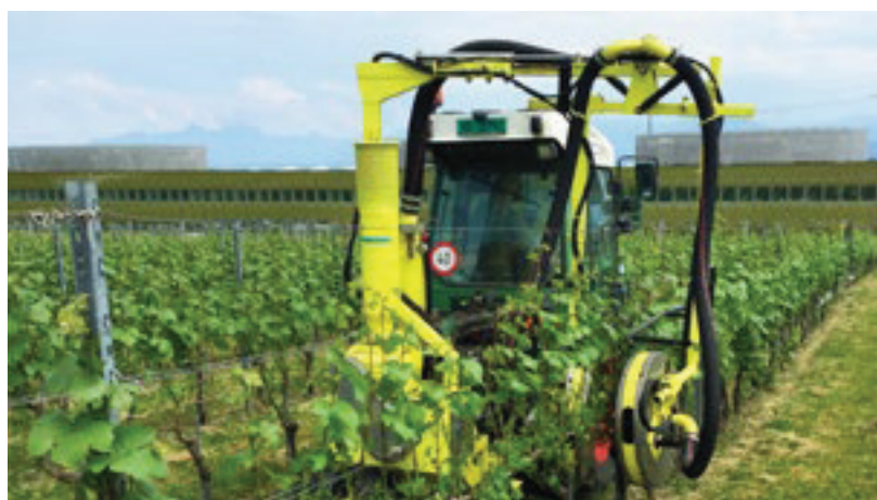
Fig. 1: Effeuillage de vignes de Gamay avant floraison, à l'aide d'une effeuilleuse basse pression à double flux d'air (Collard, Bouzy, France).

L'effeuillage mécanique a réduit le travail de dégrappage du Doral et du Gamay de 69 % et 27 % res-