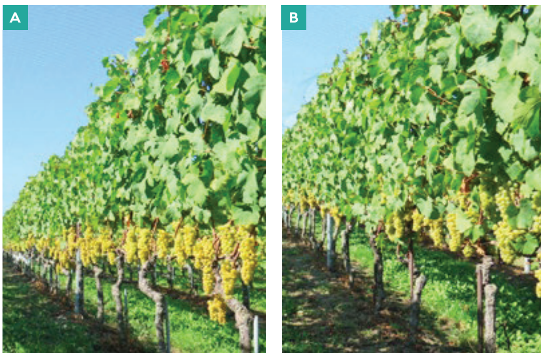
Fig. 3 : Vignes de Doral juste avant vendanges. Elles ont été effeuillées manuellement (A) ou mécaniquement (B) avant la floraison. L'effeuillage mécanique a laissé les pousses latérales qui ont ensuite partiellement recouvert la zone des grappes, alors que l'effeuillage manuel les a complètement éliminées.