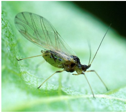
Le puceron vert du pêcher Myzus persicae