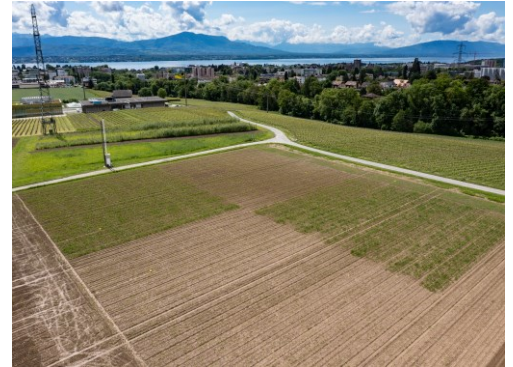
Essais au champ pendant 3 ans, avec les plantes compagnes semées entre les rangs de betteraves