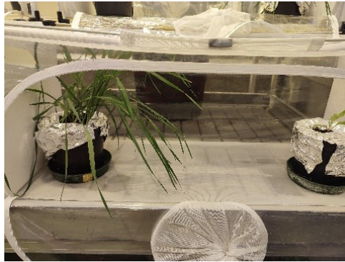
Test de choix du puceron vert du pêcher en serre