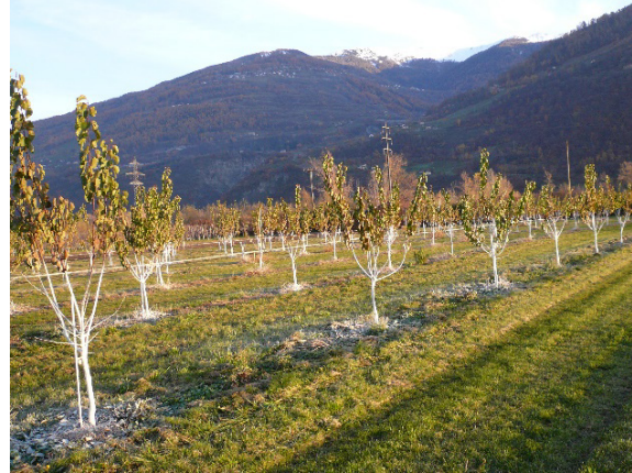
Abbildung 3: Kalken von jungen Bäumen.

In den ersten Jahren nach der Pflanzung schützt das Kalken junger Bäume, bei dem der Stamm und die Basis der Hauptäste mit Kalkmilch bestrichen werden, die Bäume vor Pilz- oder Bakterienkrankheiten. Durch das Bestreichen im Spätsommer oder frühen Herbst werden die Stämme geschützt und Eintrittspforten für die Krankheit verschlossen.