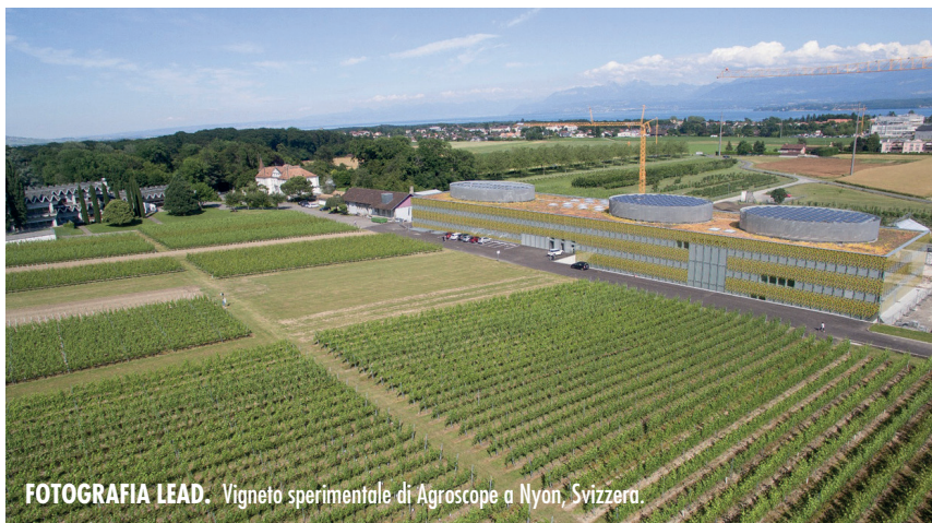
FOTOGRAFIA LEAD. Vigneto sperimentale di Agroscope a Nyon, Svizzera.

Uno studio, condotto da Agroscope, mostra come l'efficacia di una distribuzione di azoto per via fogliare all'invaiaitura dipenda dal grado di carenza iniziale della vite e conferma la soglia di sensibilità alla carenza in azoto assimilabile per lo Chardonnay, ma non per il Sauvignon blanc.