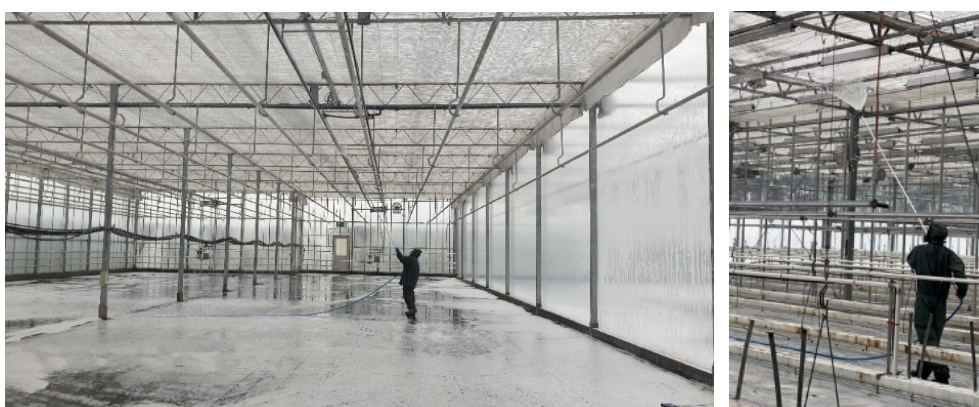
Figure 3. Désinfection d'une serre de grande taille dans laquelle les supports de culture et tous les éléments amovibles ont été démontés et sortis (photo de gauche, Service phytosanitaire cantonal de Thurgovie, Arenenberg). Traitement d'une serre de taille moyenne avec le désinfectant moussant (photo de droite, Agroscope Cédric Camps).