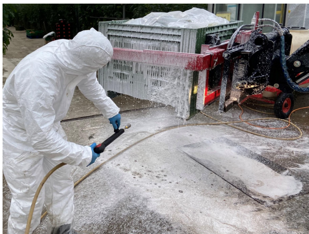
Figure 4. Nettoyage du matériel de l'exploitation (ex. palox) à l'extérieur (Service phytosanitaire cantonal de