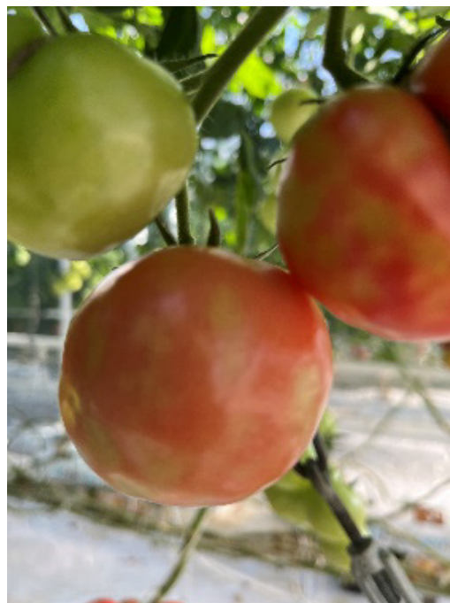
Figure 1. Exemple de symptômes de ToBRFV sur le fruit de la tomate (Cédric Camps).

La fiche technique 205/2024 « Mesures d'hygiène lors du prélèvement d'échantillons suspects et lors de travaux de nettoyage en rapport avec des organismes nuisibles pour les plantes, qui peuvent être transmis par l'homme » présente les mesures d'hygiène