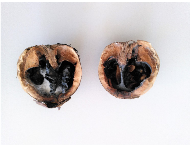
Abb. 4: Früher Fruchtbefall, trockenfauler, verpilzter Nusskern. Die Früchte fallen vorzeitig ab und werden komplett schwarz.