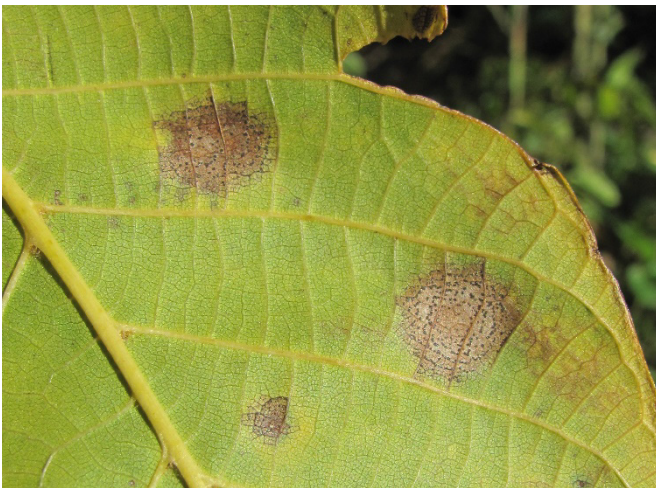
Abb. 2: Auf der Unterseite der Blätter bilden sich häufig braune bis schwarze Sporenlager (Acervuli), die durch ihre konzentrische Ringstruktur gekennzeichnet sind.