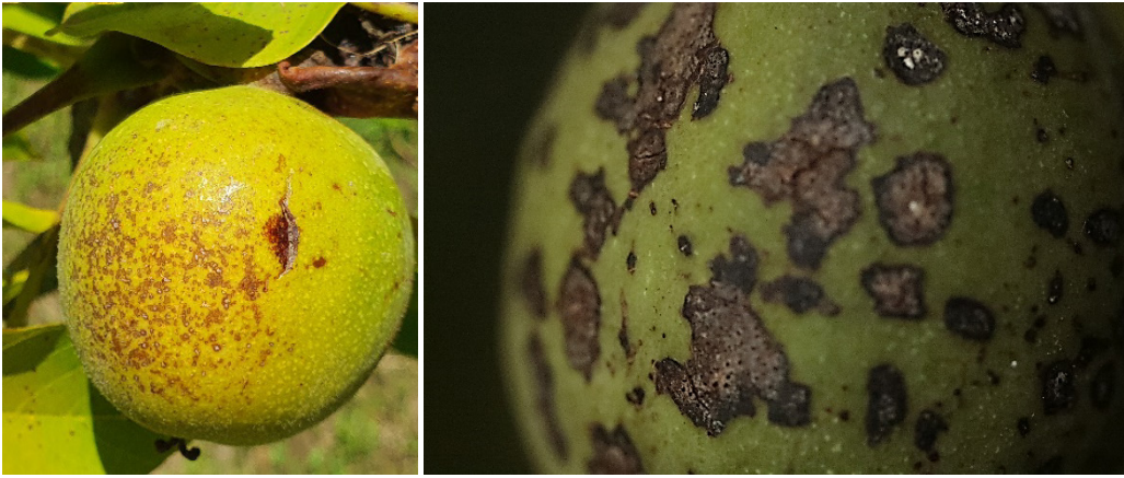
Abb. 3: Blattfleckenkrankheit der Walnuss. Links: frühe Symptome auf Früchten, rechts: ältere Symptome.