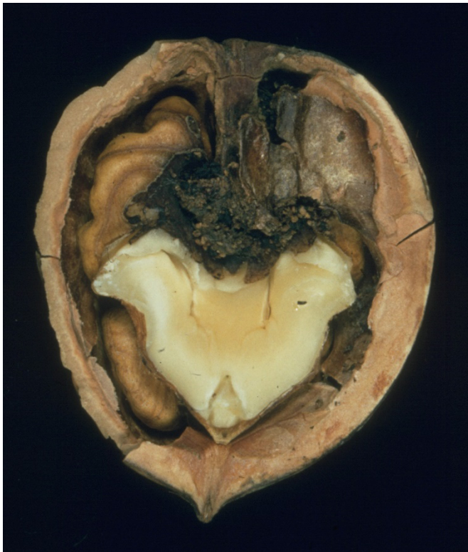
Abb. 6: Verfärbter Fruchtkern wird schleimig.