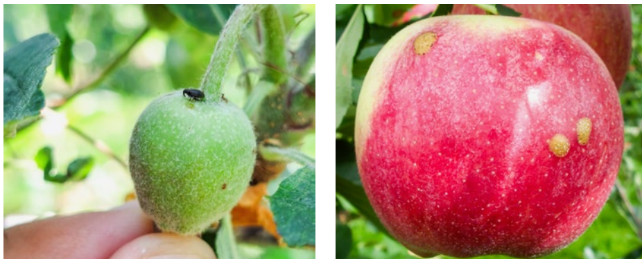
Abb. 3: Schadbild des Buchenspringrüsslers am Apfel, Anfang Juni sowie zur Ernte. Diese Schäden werden von der neuen Käfergeneration verursacht.

Käfer während der Kirschblüte in den Blüten auf und fressen an den Fruchtknoten (Abb. 4). Diese Annahme wird durch eine frühere Beobachtung gestützt, wonach Altkäfer zunächst an sekundären Wirtspflanzen wie Weissdorn einen Reifungsfrass durchführen, bevor sie auf die Buche überwechseln (Bale, 1981).