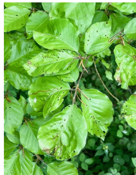
Abb. 2: Lochfrass und erste Blattminen des Buchenspringgrüsslers an Buche (Mitte Mai).

Aktuelle Beobachtungen weisen jedoch auf ein anderes Muster hin. Im Jahr 2023 traten Schäden an Kirschen bereits sehr früh auf, noch bevor die Buchen austrieben. Mitte April wurden Käfer in Kirschanlagen nachgewiesen. Es muss sich daher um überwinternde Altkäfer gehandelt haben. Auch im Folgejahr wurde in einer Parzelle bereits vor der Blüte ein starker Einflug von Buchenspringgrüsslern verzeichnet. Vermutlich hielten sich diese