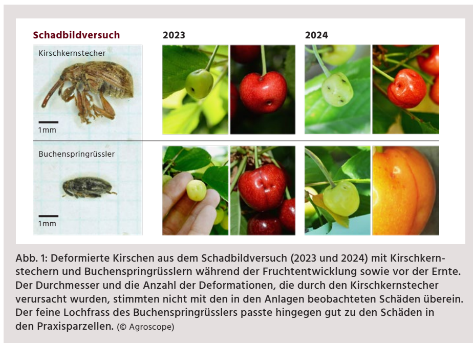
Abb. 1: Deformierte Kirschen aus dem Schadbildversuch (2023 und 2024) mit Kirschkernstechern und Buchenspringgrüsslern während der Fruchtentwicklung sowie vor der Ernte. Der Durchmesser und die Anzahl der Deformationen, die durch den Kirschkernstecher verursacht wurden, stimmten nicht mit den in den Anlagen beobachteten Schäden überein. Der feine Lochfrass des Buchenspringgrüsslers passte hingegen gut zu den Schäden in den Praxisparzellen.

Deformierte Kirschen mit kraterförmigen Dellen und Einbuchtungen werden im Schweizer Obstbau traditionell dem Kirschkernstecher ( Furciproxystus caryocarpae ) zugeschrieben. Der Rüsselkäfer bildet eine Generation pro Jahr und erscheint im Frühjahr zur Kirschblüte. Nach einem kurzen Reifungsfrass erfolgt die Eiablage in den noch weichen Kirschenkern, wo sich die Larve entwickelt. Bevorzugt werden kleinere Früchte, insbesondere von Vogel- und Traubenkirsche sowie von Sauerkirschen (Schneider, 1947). Bis 2021 stand mit Thiacloprid (Alanto) ein wirksames Pflanzenschutzmittel zur Regulierung des Kirschkernstechers zur Verfügung. Mit dem Rückzug des Wirkstoffs entstand ab 2022 eine Bekämpfungslücke. Derzeit sind in der Schweiz keine Wirkstoffe gegen diesen Schädling zugelassen.