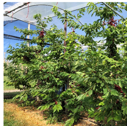
Ausgeglichene Bäume: Penny auf Gisela 6 im 4. Laub.

Penny ist eine optisch und aromatisch erstklassige Kirsche im spätesten Reifesegment. Sie überzeugt mit hoher Festigkeit und dicken, fleischigen Stielen. Penny ist sehr platzstabil, jedoch nicht vollständig hitzetolerant.