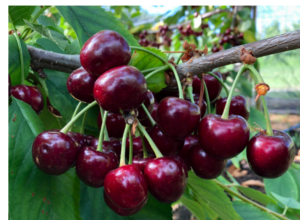
Homogene Reife. Penny zur Ernte am 29. Juli 2019.