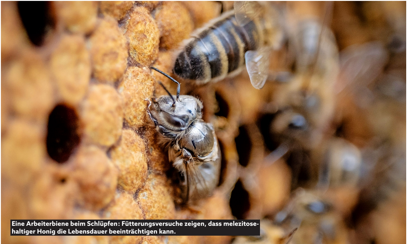
Eine Arbeiterbiene beim Schlüpfen: Fütterungsversuche zeigen, dass melezitosehaltiger Honig die Lebensdauer beeinträchtigen kann.