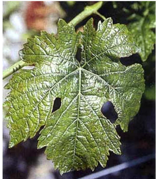
Premiers symptômes de carence en potassium: le centre de la feuille devient brillant et le pourtour commence à se décolorer (vert pâle) et s'enrouler (cépage: Humagne rouge).

Elaboré par Agroscope RAC et FAW Wädenswil .