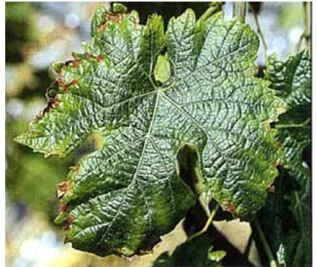
Dans les cas de carence potassique grave, des nécroses apparaissent sur le bord des feuilles (en haut sur Pinot noir, en bas sur Humagne rouge). La décoloration apparaît toujours sur le pourtour du limbe.