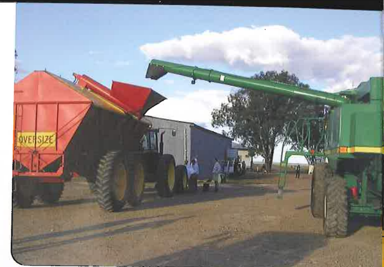
Überladewagen und Traktor mit verbreiteter Spur und Mährescher mit verlängerter Überladeschnecke.

Einsatz immer schwerer werdender Erntemaschinen unter feuchten Erntebedingungen im Herbst ist problematisch. Die Auswirkungen des Klimawandels bringen zusätzliche Herausforderungen. Im Winter kann es zu einer stärkeren Verschlammung und Erosion durch Niederschläge kommen. Im Sommer können häufiger Trockenheitsschäden, Hitzestress und Starkregen auftreten. Die bisherigen Erfahrungen mit CTF legen nahe, dass eine kontrollierte Befahrung auch bei uns viele Vorteile bieten könnte.