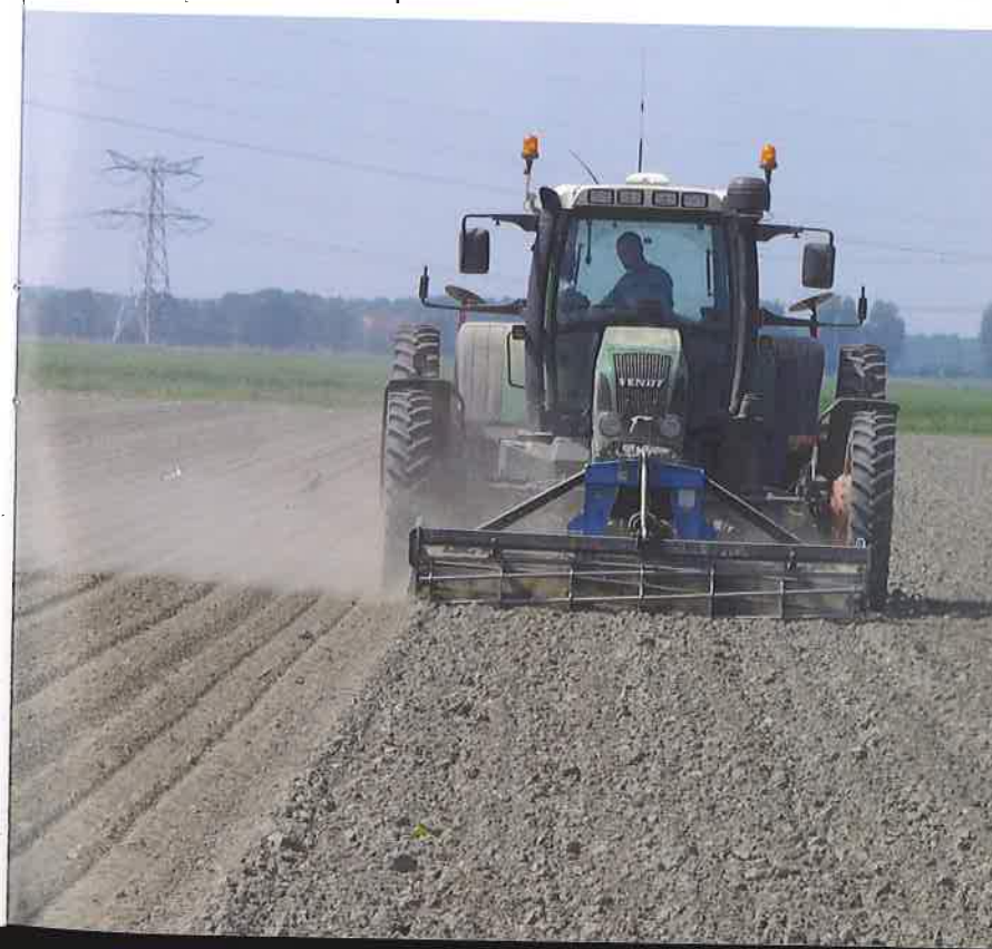
Traktor mit verbreiteter Spur.

Wichtigster Aspekt bei dem auf semiariden Standorten angebauten Weizen ist der positive Einfluss auf die Wasserverfügbarkeit und -infiltration. Zuckerrohr wird auf feuchten, subtropischen Standorten in Beeten gepflanzt. Mit CTF werden ganzflächige Bodenverdichtungen durch die schweren Erntemaschinen vermieden. Die Insel Tasmanien ist mit ihrem mitteleuropäisch-gemäßigten Klima ein bevorzugtes Gemüseanbaugbiet. Hier verbessert CTF die Bodenstruktur und verringert die Erosionsgefahr. Unter unseren mitteleuropäischen Bedingungen finden sich einige Parallelen. Der