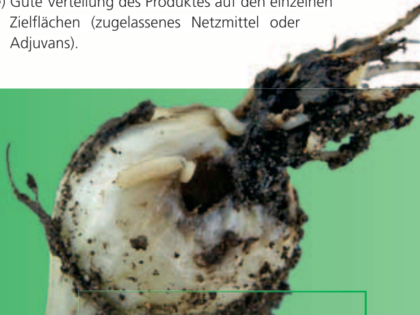
Organische Düngung zur Herbstfurche kann den Befall durch Zwiebelfliege im Folgejahr fördern

Bei diesen Düsen wird die Spritzbrühe in zwei Spritzfächer aufgeteilt, welche von oben nach vorne unten und nach hinten unten gewinkelt in die Kultur appliziert werden. Diese Düsen sollen in dem vom Hersteller empfohlenen, niedrigen Druckbereich betrieben werden, damit nur ein geringer Anteil an driftgefährdeten kleinen Tröpfchen erzeugt wird. In der Praxis können allerdings nicht immer windstille Bedingungen abgewartet werden. Es wird aus praktischen Gründen auch bei leichtem