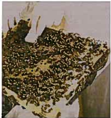
Figure 3: Prélèvement d'abeilles du nid à couvain au moyen de boîtes d'allumettes

Afin de soutenir les inspecteurs dans leur travail, l'idée serait de déléguer la prise d'échantillons (Figure 3) aux détenteurs des colonies se trouvant dans les zones de séquestre. Après analyse de ces abeilles, les inspecteurs n'iraient visiter que les ruchers contenant le germe. Ceci éviterait la visite des ruchers exempts de M. plutonius , et ainsi permettrait une réduction potentielle des coûts. Malheureusement, après le calcul de différents scénarios (selon l'exemple