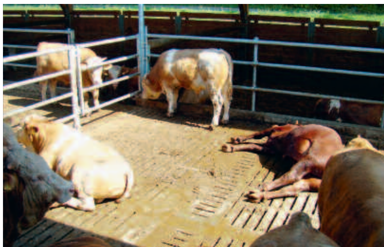
Schadgasunfall während dem Aufrühren von Gülle in einem Offenstall. Schwülwarmes Wetter mit fehlendem Luftaustausch über dem Spaltenboden begünstigte den Unfallverlauf.

Wie entstehen Schadgase? Die Lagerung von Gülle erfolgt meist unter Ausschluss von Sauerstoff (anaerob). Dabei entstehen unter anderem die in Tabelle aufgeführten Schadgase Schwefelwasserstoff (H 2 S), Ammoniak (NH 3 ),