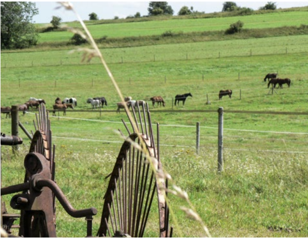
Abb. 4 | Die Pensionspferdehaltung bietet zahlreichen Landwirten eine rentable Möglichkeit zur Diversifizierung ihrer Betriebe.

das Pferd heute in erster Linie als Freizeitpartner gehalten. Mit diesem Wandel ging auch eine Veränderung der an die Pferdehaltung gestellten Ansprüche einher. Dies macht sich vor allem in diversen Anpassungen verschiedener Gesetzgebungen bemerkbar.