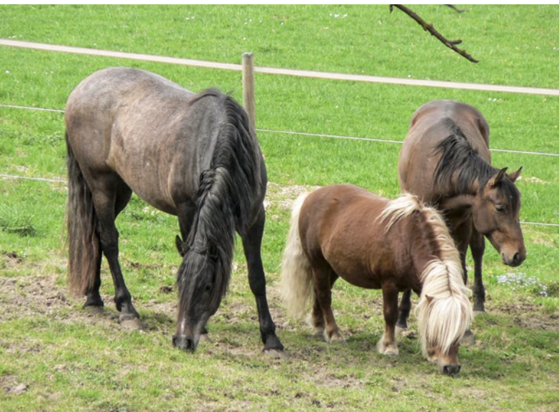
Abb. 1 | Bislang war es aufgrund der fehlenden Registrationspflicht kaum möglich, genauere Aussagen über die Struktur des Schweizer Equidenbestandes zu machen. Seit 2011 müssen nun alle Equiden auf der zentralen Tierverkehrsdatenbank TVD gemeldet werden.

Auskunft: Ruedi von Niederhäusern, E-Mail: ruedi.vonniederhauesern@agroscope.admin.ch