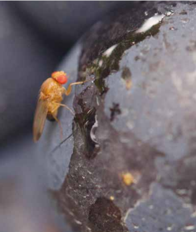
Figure 1 | Mâle de Drosophila suzukii , reconnaissable à sa tache noire au bout de l'aile, sur une baie de raisin.

A la fin de l'été 2014, la drosophile du cerisier Drosophila suzukii (fig. 1) a suscité un grand émoi dans le monde vitivinicole suisse car l'insecte était abondamment présent et la pourriture acide gagnait du terrain dans les vignes. Cette maladie a causé la perte d'environ 10 % de la récolte en Suisse et généré des travaux de tri fastidieux et une charge supplémentaire considérable lors des vendanges, dont certaines ont été parfois anticipées pour préserver la qualité du raisin. Toutefois, la drosophile du cerisier n'a pas été l'unique facteur de propagation de la pourriture acide.