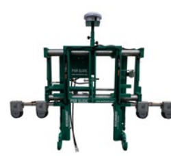
Abb. 4: Ultraschallbasiertes Regelsystem, links an der Hacke, rechts am Querverschieberahmen.