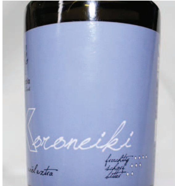
Abb. 3: Auf dem Etikett einer Olivenölflasche erlaubter Sensory Claim.

Zudem gibt es bereits Standardvorgaben, die Produzenten und Händler nutzen können und sollen, um die sensorischen Besonderheiten ihrer Produkte den Konsumenten näherzubringen. Vom Gesetz her bewegt sich deren Verwendung allerdings noch in einer Grauzone. Ein vermehrter und seriöserer Gebrauch