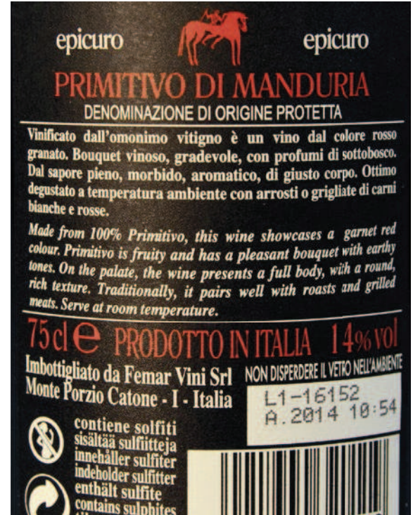
Abb. 2a und b: Beispiele von vergleichendem (a. Tomate) und nicht vergleichendem Claim (b. Wein).

Um einen sensorischen Claim zu nutzen, sollte man ihn auch beweisen können. Bei der Umsetzung ist deshalb die Wahl der richtigen Prüfergruppe entscheidend. Je nach Ansatz, den man verwenden will, benötigt man für die Verifizierung geschulte Prüfer (objektives Panel) oder ungeschulte Konsumenten (hedonisches Panel). Sollen sensorische Eigenschaften beschrieben werden, wird der Einsatz von hedonischen Panels empfohlen, da auch der Käufer die angepriesenen Eigenschaften verstehen soll. Die Anzahl der eingesetzten Probanden reicht je nach Richtlinie bis zu 300 Personen. Wenn allerdings Intensitäten von sensorischen Eigenschaften angesprochen werden, ist der Einsatz eines objektiven Panels angezeigt. Solche Prüfergruppen erzeugen aufgrund regelmässiger sensorischer Trainings wiederholbare Ergebnisse. Im Vordergrund steht aber bei den meisten Richtlinien und Standards, dass der Verbraucher die verwendeten Begrifflichkeiten beziehungsweise Anpreisungen versteht.